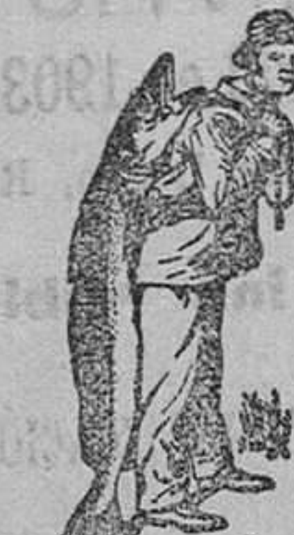
Obténase siempre la Emulsión con esta marca "El Pescador" marca del procedimiento Scott!

“EL PESCADOR Y EL PESCAO” en la envoltura garantiza los mejores ingredientes, la elaboración mas hábil y por consiguiente los efectos mucho mas energicos, que en ninguna otra emulsión; ventajas que valen mucho más, que el pequeño aumento en el precio que exigen. En todas las farmacias, Empiece hoy! D. Carlos Marés, Calle de Valencia No. 333, Barcelona, envía muestra gratis al que remita 75 cts. en sellos para el franqueo.