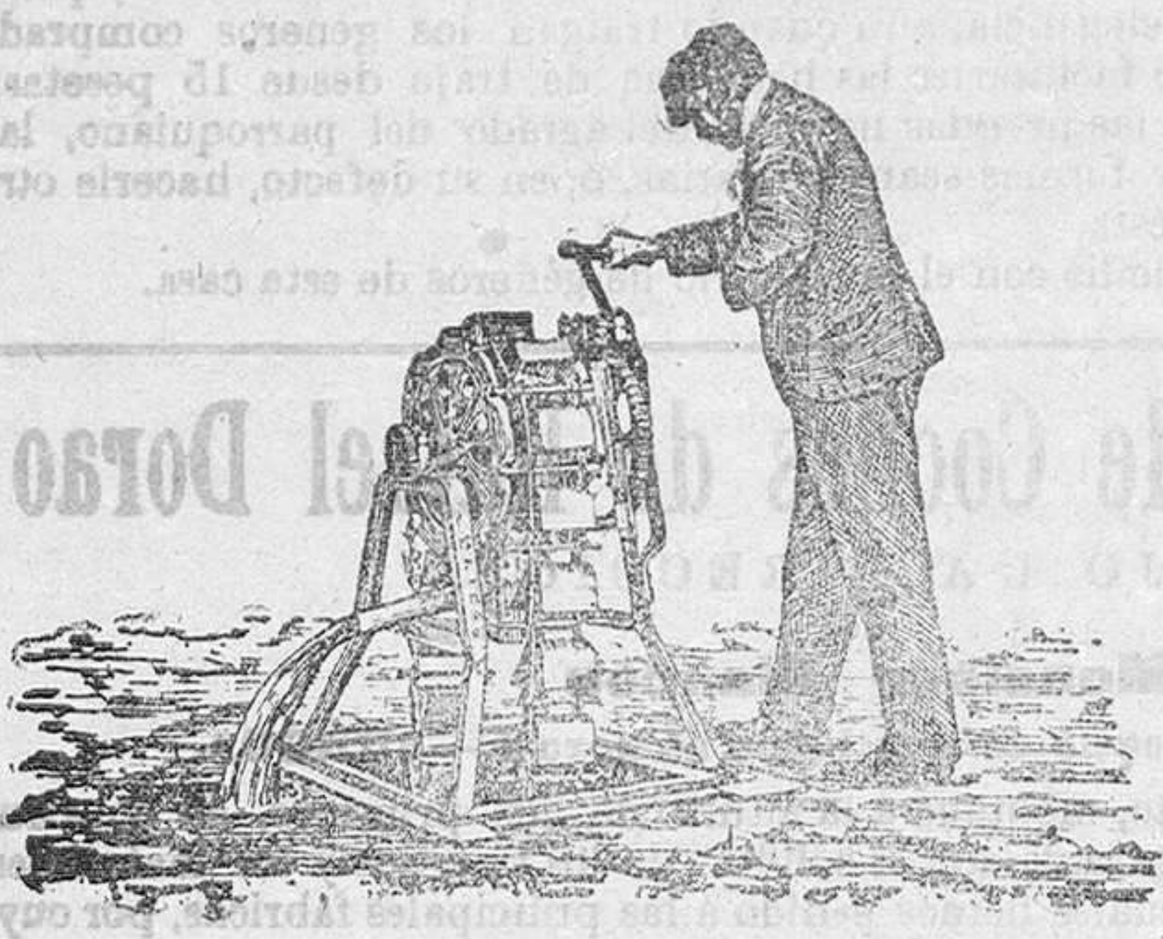
Noria de mano

Gran surtido en plantas de salón, balcones y jardines. Semilla de Ray-Gras, inglés, para la formación de praderas. Calle Villalón, de núm. 15, jardín.—(Barrio de San Pedro de la Fuente).