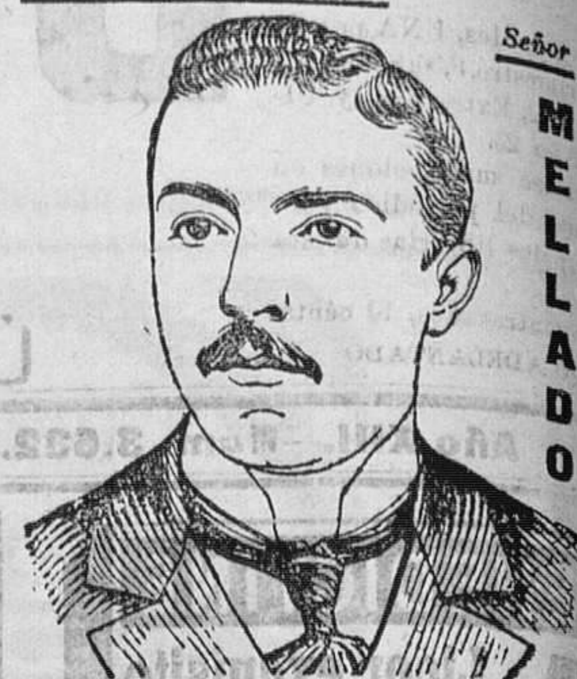
Madrid 29 de Abril de 1903.

Desde mucho tiempo hallábame en tal estado de anemia, desgarro y debilidad general, que al salir a paseo al poco rato la fatiga me rendía. En ese estado me aconsejaron de tomar la Emulsión Scott, y en verdad el resultado ha sido lo más satisfactorio. Cuas cuantas botellas me han bastado para restablecerme. La anemia ha desaparecido, he recuperado un buen apetito, y con él las carnes y fuerzas perdidas, considerándome ahora completamente curado gracias a la inapreciable Emulsión Scott.