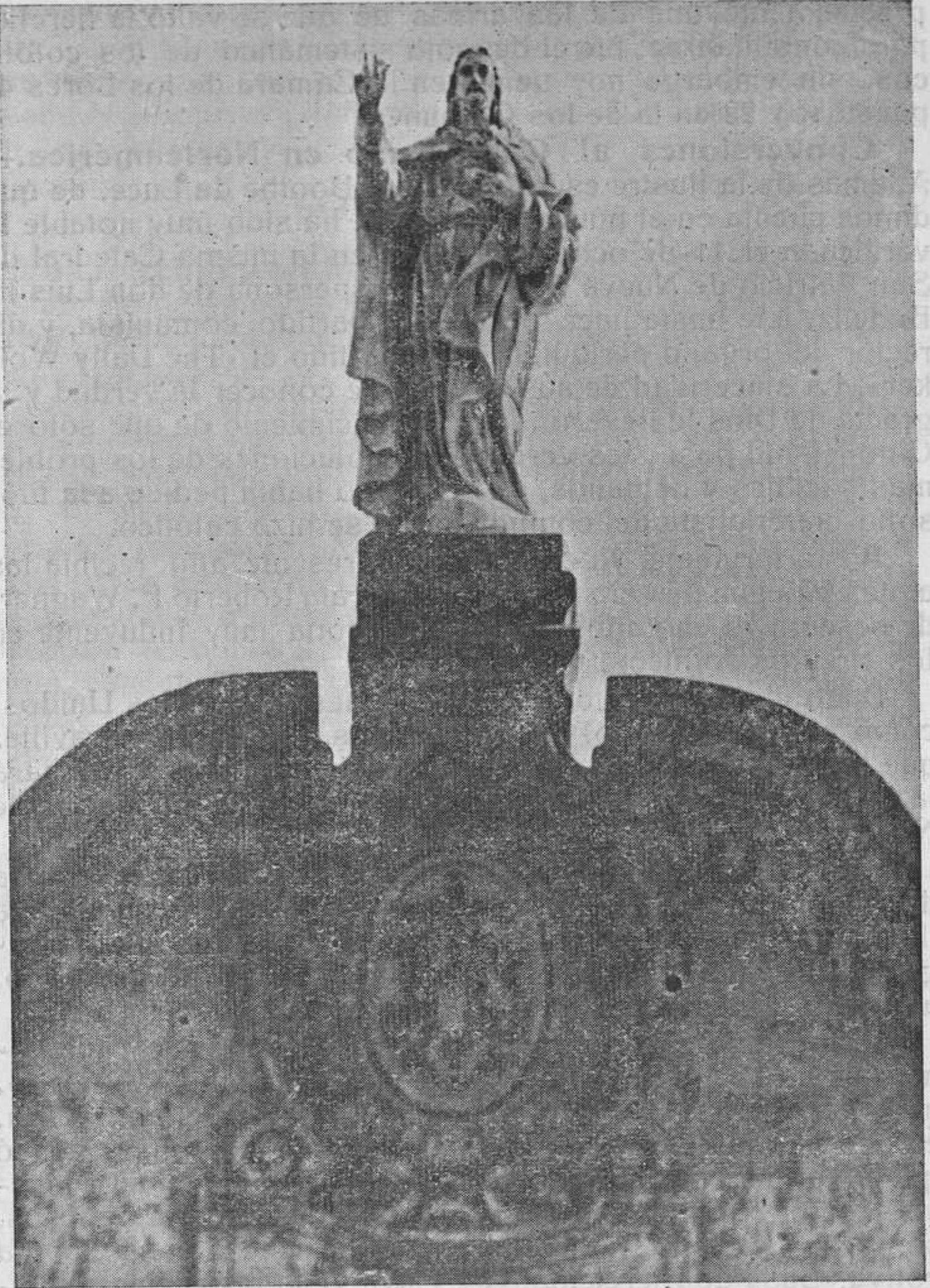
Monumento al Sdo. Corazón de Jesús, en el Colegio Noviciado de la Compañía.-Salamanca