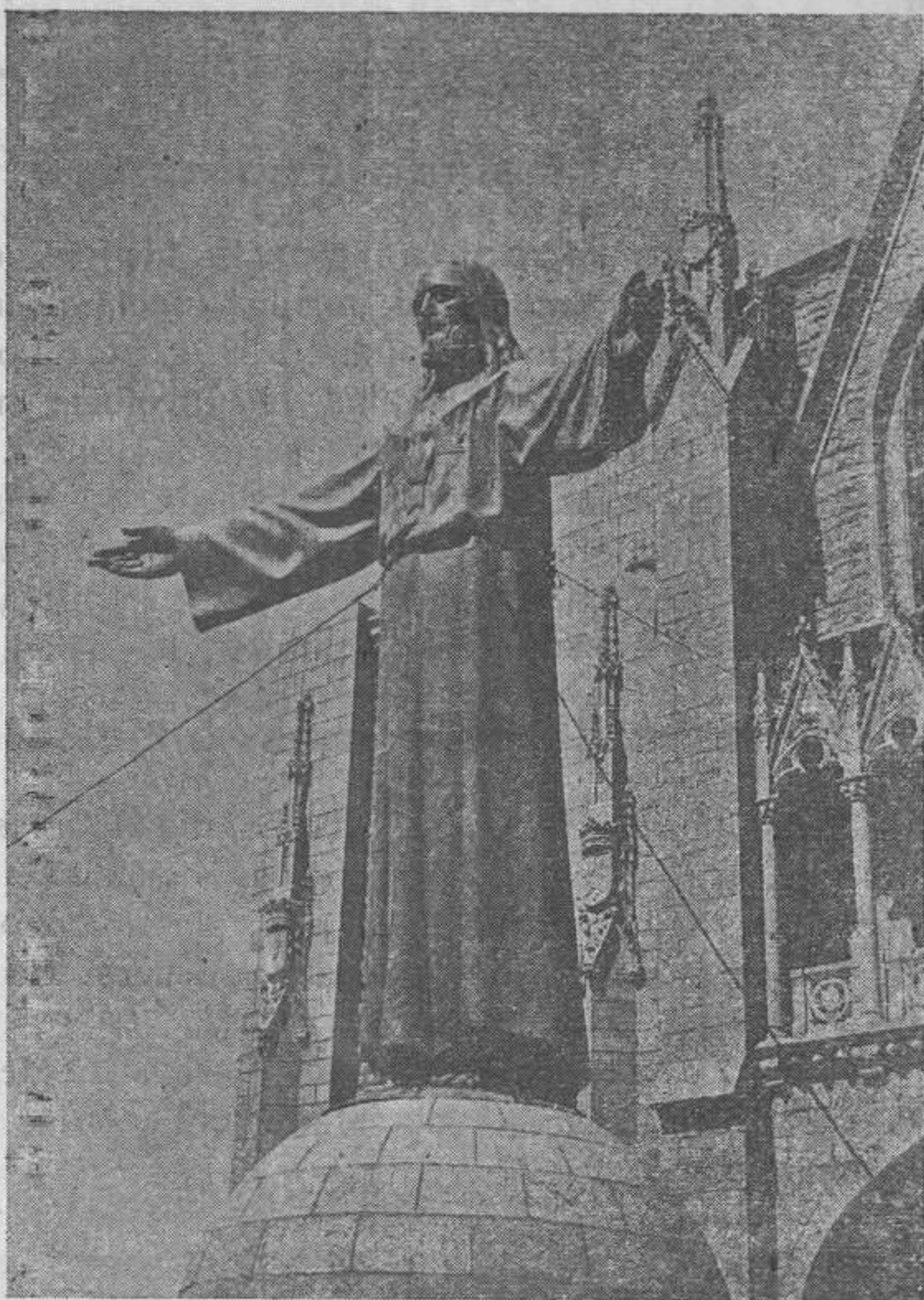
Estatua del Sdo. Corazón derribada por los rojos el 25 de julio de 1936 Y que restaurada, ha de coronar el grandioso templo

NOTA.— Esta hermosísima imagen fué destruida y fundida, durante el período rojo.