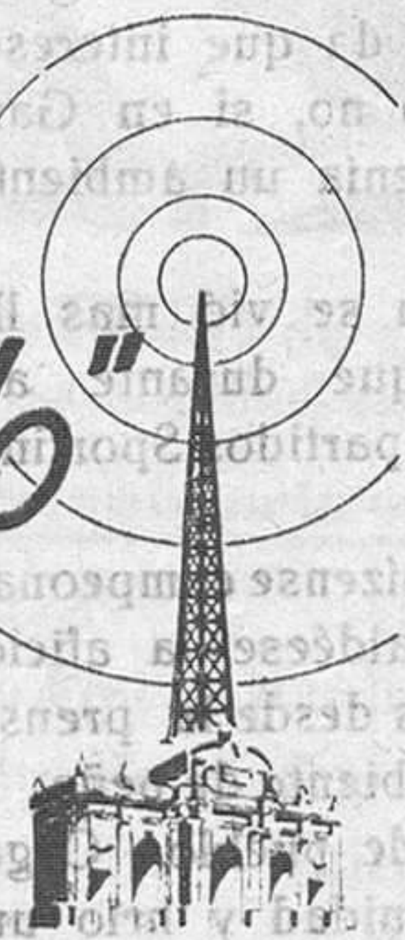
Con el receptor Philips "La llave del mundo" oirá Ud. la futura Emisora Nacional de Madrid, que radiará en onda larga.

Toda la radio, a todas las horas, en todas las ondas. La onda extracorta, captada con una seguridad hasta hoy desconocida. El receptor más completo y más perfecto que puede construirse hoy