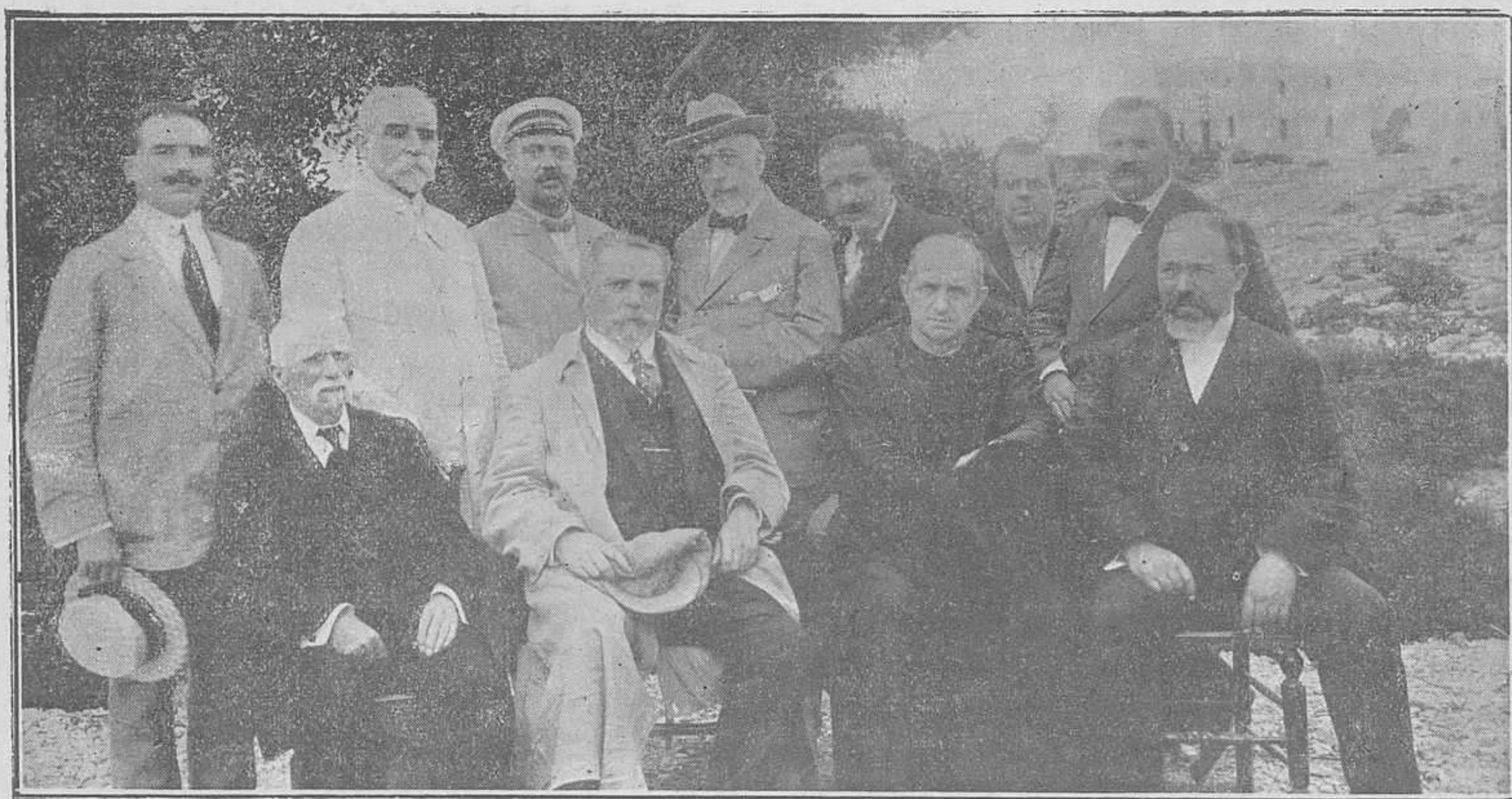
Señores que formaron la Comisión Inspectora del Sanatorio.