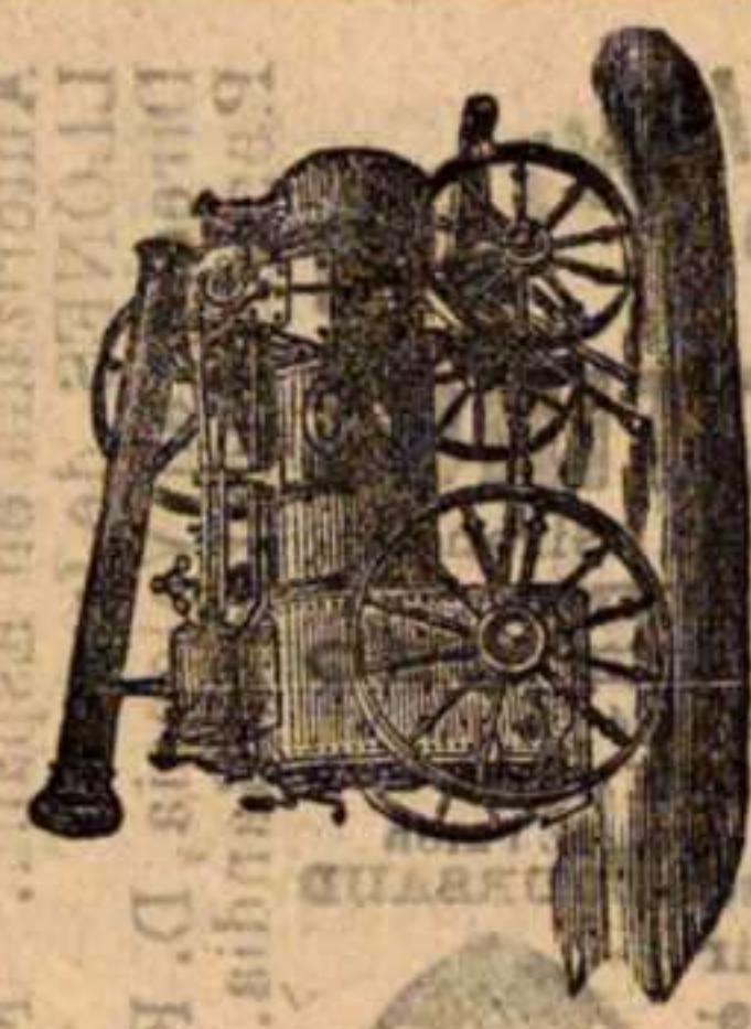
Máquina de vapor