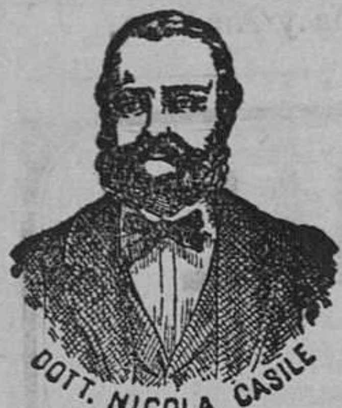
Inventor de los renombrados medicamentos CASILE

han logrado que el doctor Casile de Nápoles descubriera los milagrosos medicamentos que curan infaliblemente la tisis en cualquiera de sus períodos y todas las enfermedades del estómago. A la más pequeña manifestación de un resfriado, tos, catarro, bronquitis, gripe, asma (sufocación), espectoración y de cualquier enfermedad del pecho, tomar inmediatamente las Perlas Casile , que no solo curan infaliblemente estas enfermedades, sino que se tendrá la completa seguridad de no contraer otras mucho más graves. Siguiendo este método se podrá decir no más tisis . Si por descuido no se hubiera seguido este tratamiento y por desgracia cualquier persona se encontrara atacada de tisis no tiene que purarse porque gracias á los constantes estudios hemos podido encontrar los renombrados Confites Casile que asociados á las Perlas combaten con eficacia la tisis en cualquiera de sus períodos.