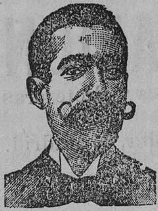
Inventor de los renombrados medicamentos COSTANZI Calle Diputación 435 BARCELONA

Roob Antisifilítico COSTANZI Inyección Vegetal