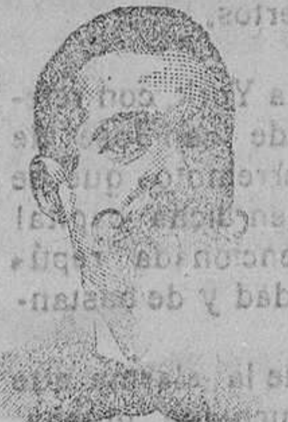
Inventor de los renombrados medicamentos COSTANZI Calle Diputación 435 BARCELONA

Roob Antisifilítico COSTANZI Inyección Vegetal