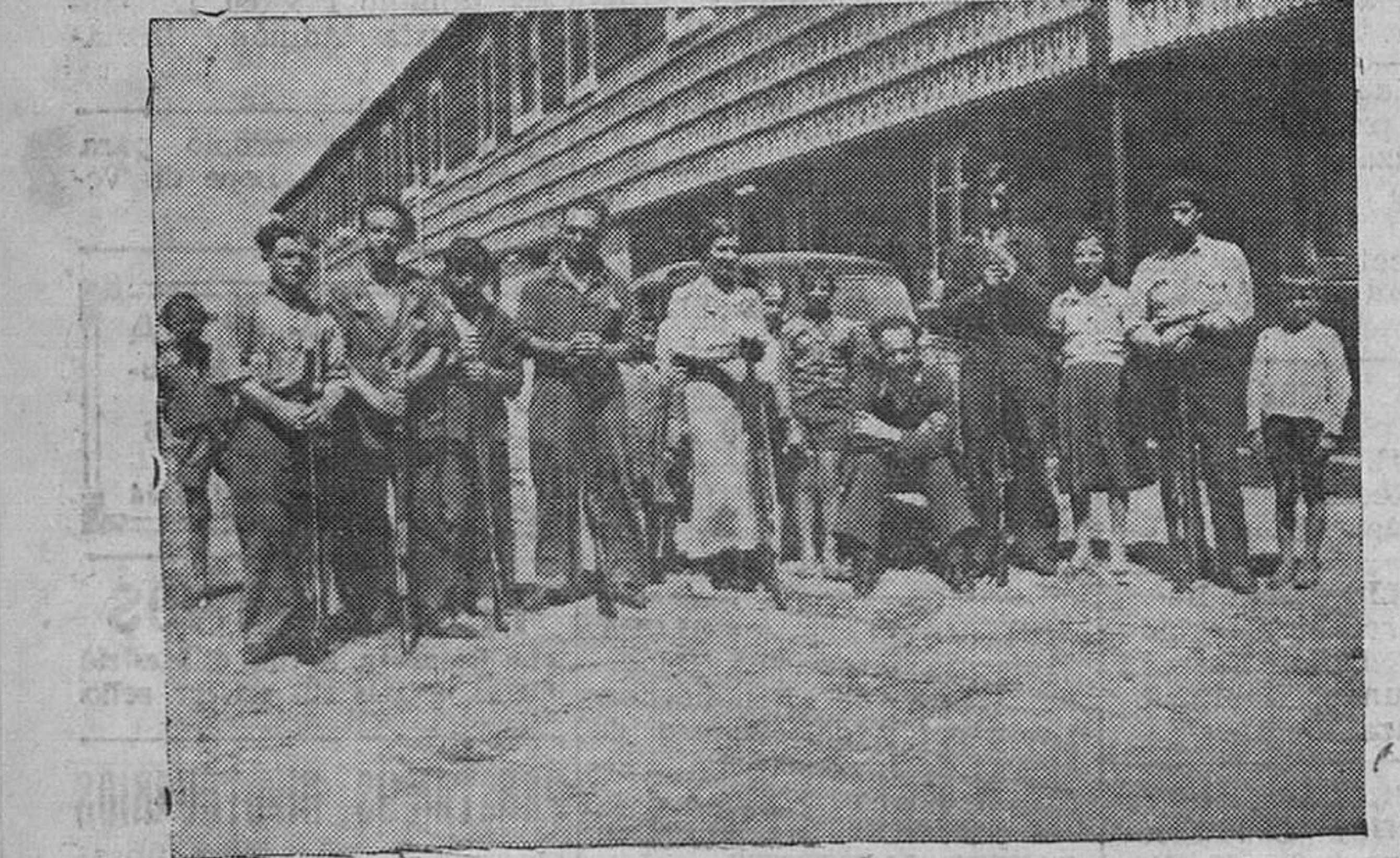
EN NUEVA MONTAÑA. — Un grupo de milicianos, en el que aparece también una mujer, y que están dispuestos a luchar contra los fascistas.

Para las carreras en sacos y pedestres participarán infinidad de chicos escolares: veintidós para pedestres, y veintitrés, para la de sacos.