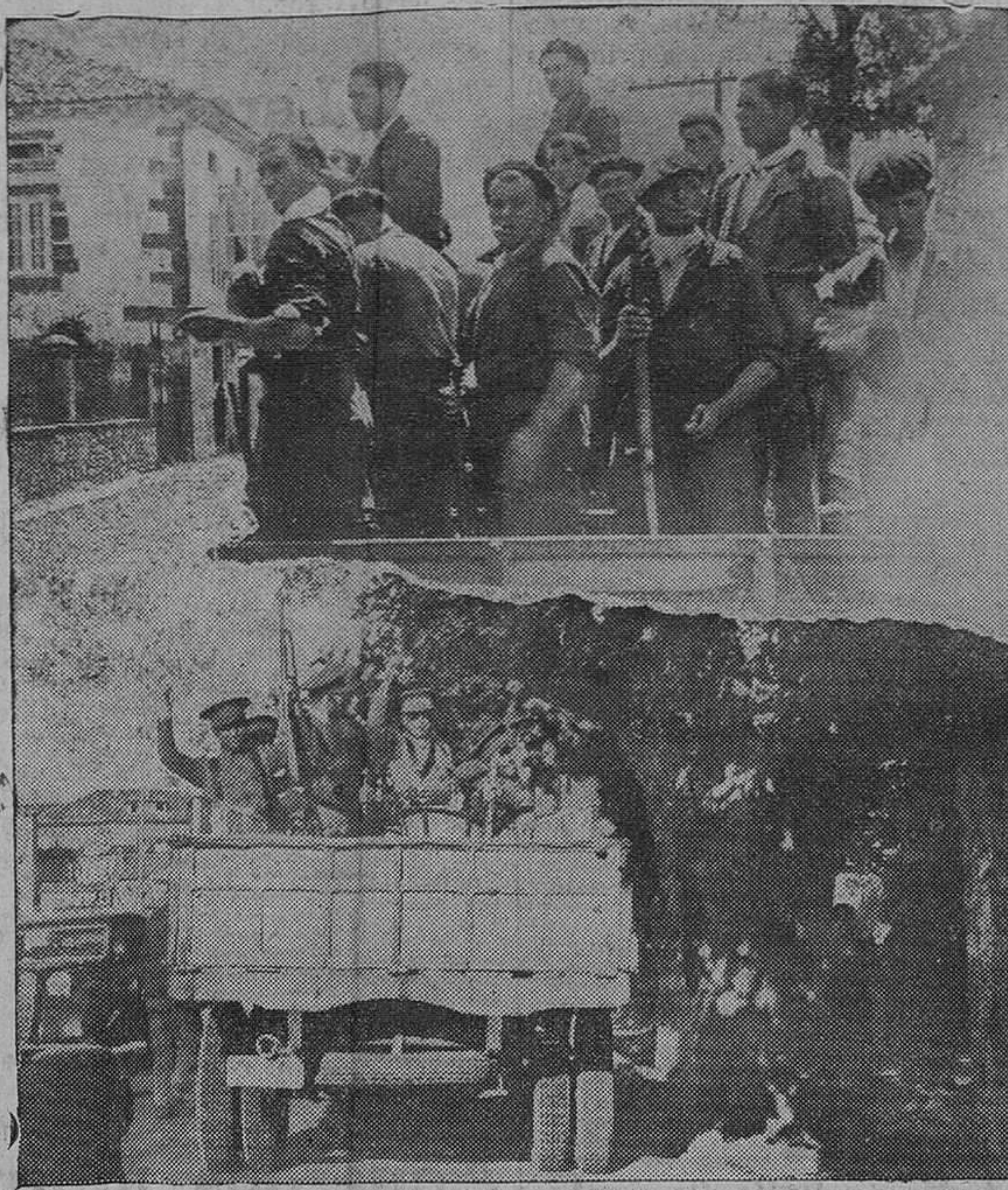
LAS MILICIAS Y LOS CARABINEROS, EN EL FRENTE. — Un camión de milicianos camino de uno de los frentes. — Los carabineros saludando con el puño en alto a su paso por uno de los pueblos.

Deseamos todos los españoles de buena voluntad, que cuando se reúna en Ginebra la gran asamblea juvenil defensora de la paz mundial, puedan vivir pacíficamente en su amada patria los jóvenes españoles.