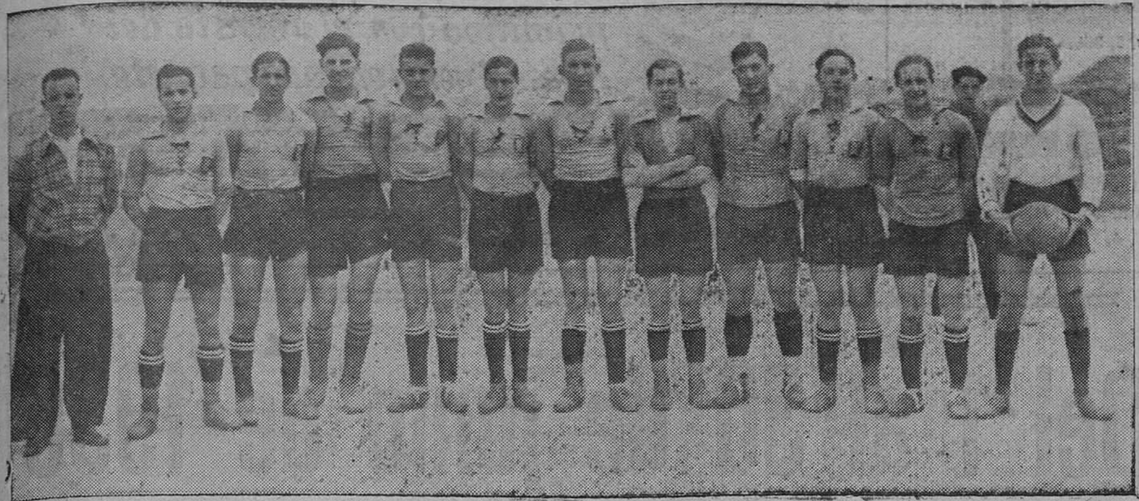
LOS CLUBS MODESTOS. — El Daring Club, equipo que tan gran actuación está consiguiendo en el Campeonato de su serie.