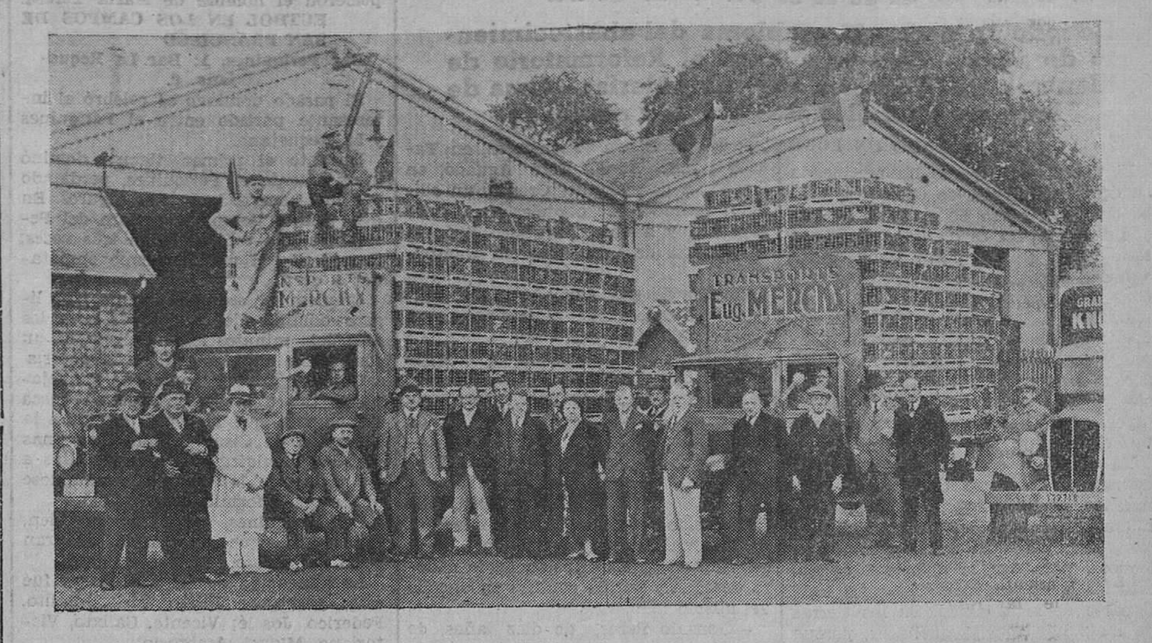
Momento de embarcar las palomas que llegarán a este puerto el jueves próximo.

La Prensa toda del país belga se ocupa estos días del gran concurso nacional de palomas mensajeras que se efectuará en la mañana del sábado en nuestra ciudad. Tan grande es la expectación y popularidad de la prueba, que periódicos como «Le Soir», de Bruselas, la equiparan a la Vuelta Ciclista a Francia. Y es que en Bélgica los concursos de más difusión son los colombófilos, en los que se cruzan apuestas importantísimas.