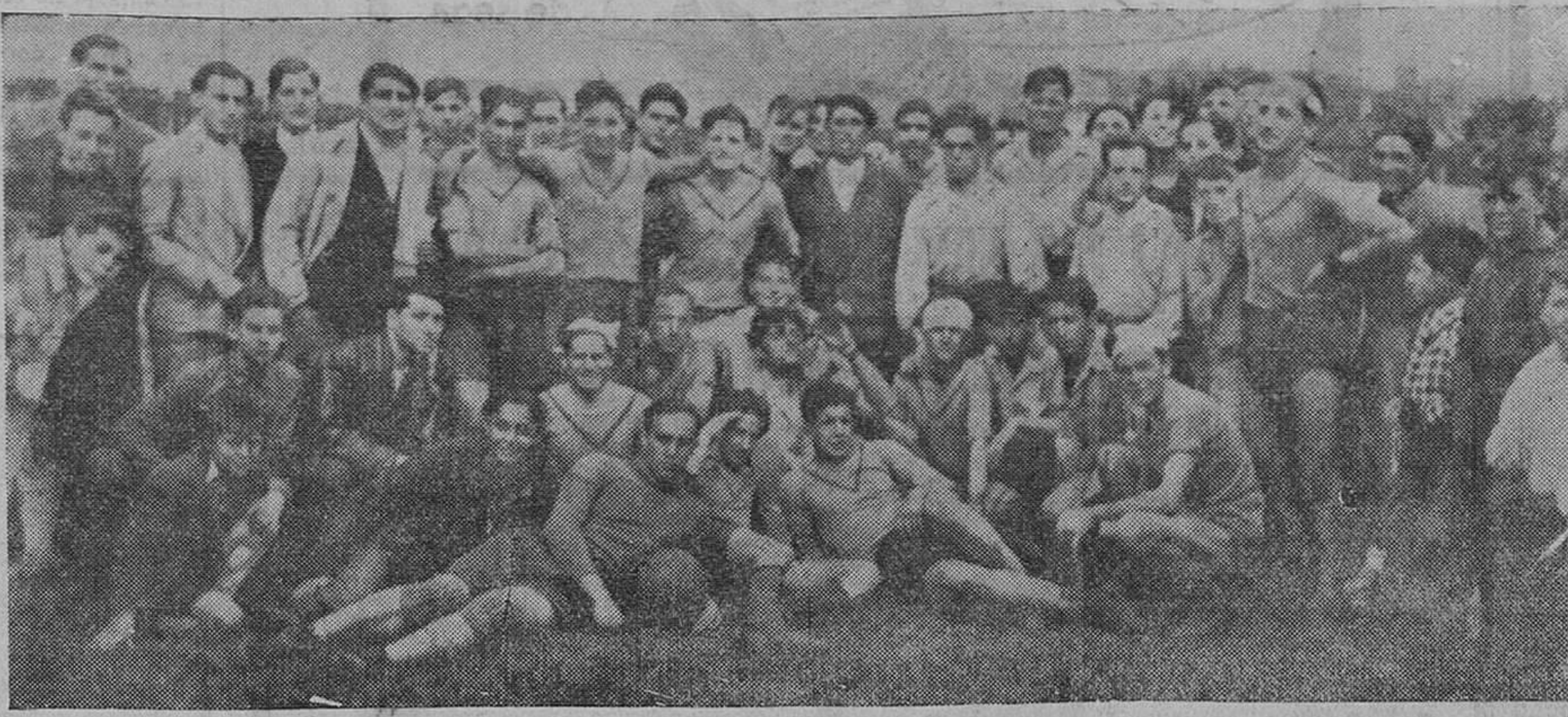
Los jugadores del Athletic Club de Miranda, vencedores de «Campaneros», que jugaron un partido mañana en el domingo pasado, venciendo al Valdilla.

También se advierte a los clubs que desde el día 15 de este mes se entregarán las fichas de la temporada de 1936-1937.