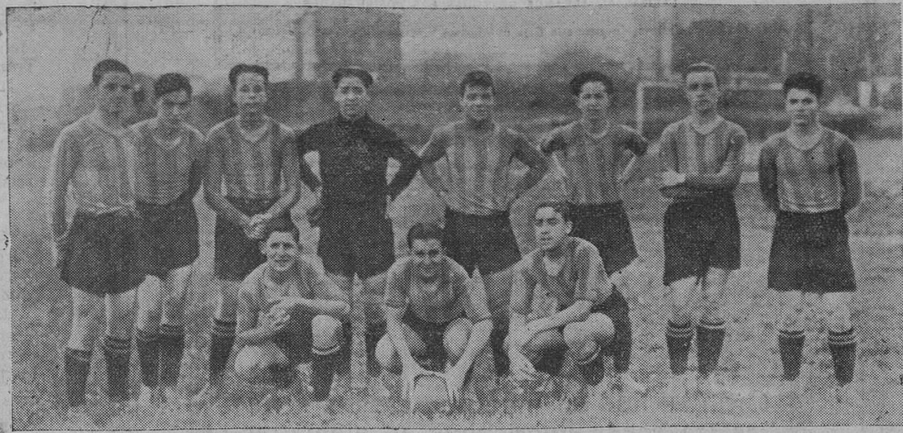
El Unión Montañesa infantil, que tan brillante actuación viene haciendo en el Campeonato de Clubs Modestos.