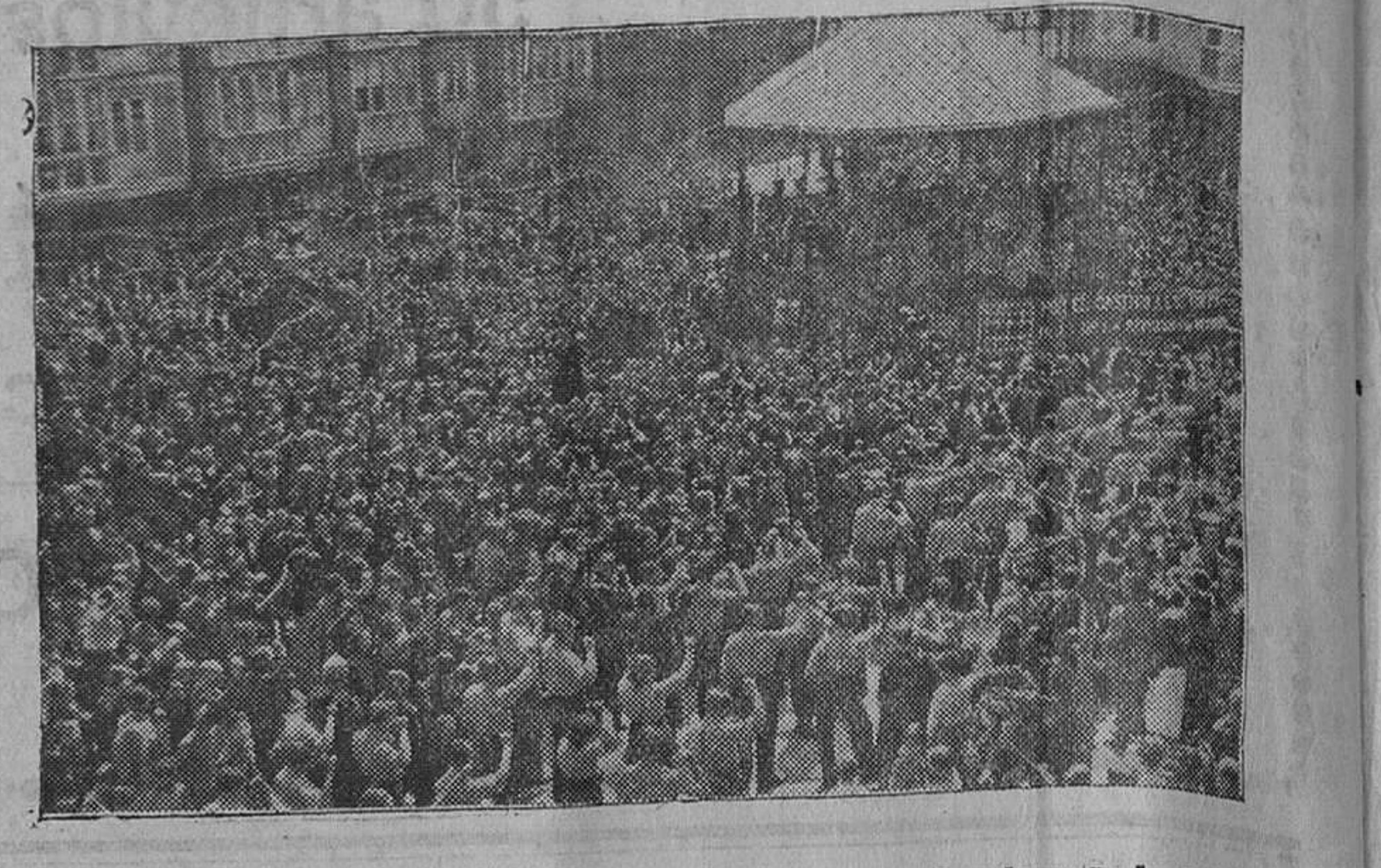
EL PRIMERO DE MAYO EN REINOSA. — Paso por la plaza de la República de la manifestación obrera, mientras la música da su concierto.