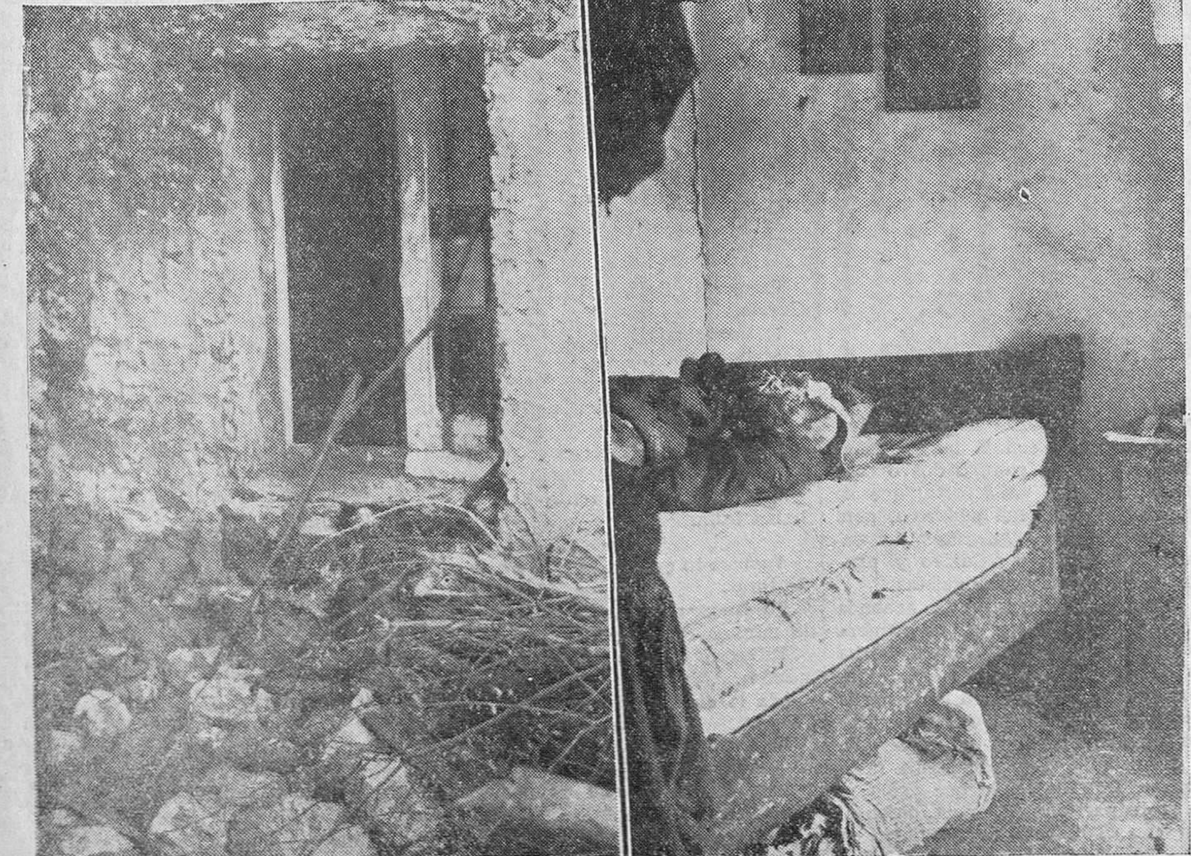
Ventana por donde entraron los criminales después de arrancar los hierros, y la miserable habitación donde apareció muerto el labrador.

Pleamareas: 9'31 m. y 10'22 t. Bajamareas: 3'24 m. y 4'8 t. Coeficiente medio: 34 m. y 35 t. (Para obtener la hora local hay que restar quince minutos.)