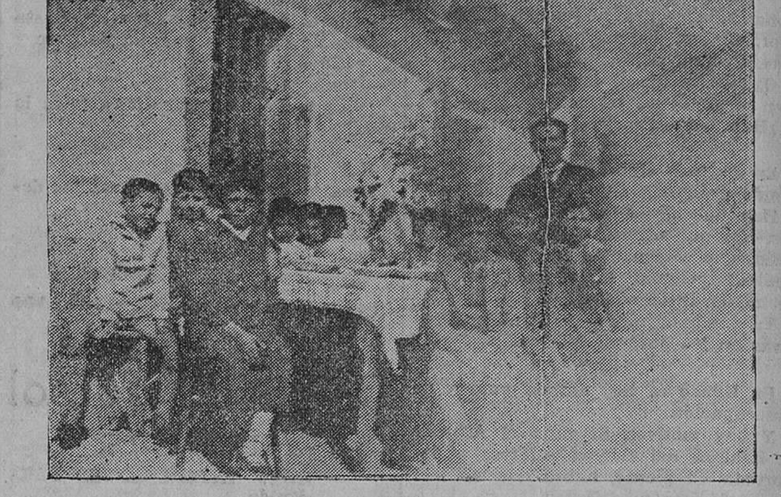
LLANO-SOVIÑA. — Uno de los tres grupos de que se compone la cantina escolar de San Felices de Buelna.

El aspecto pedagógico, íntimamente unido al educativo, son ambos, a la vez, dignos de gran atención. Los maestros, principalmente, y, desde luego, los padres de familia también, si deseamos conocer al niño con toda la amplitud posible en las diferentes y múltiples manifestaciones de su vida, para mejor educarlo en sus juegos, en sus quehaceres, observándole hasta cuando duerme, no olvidemos tampoco que el estudio que los pequeños escolares nos ofrecen cuando diariamente presenciemos la dichosa hora de la comida durante una temporada, es una magnífica coyuntura que nos brindan con naturalidad absoluta, y entonces no es raro que, por efecto de la confianza que engendra el continuo trato al realizar actos de tal carácter, dejen al descubierto muchas tendencias e inclinaciones que antes permanecerían ocultas. Y no es sólo eso, porque al maestro que es celoso en su profesión, todo lo que afecte a sus discípulos de interesa a él en gra-