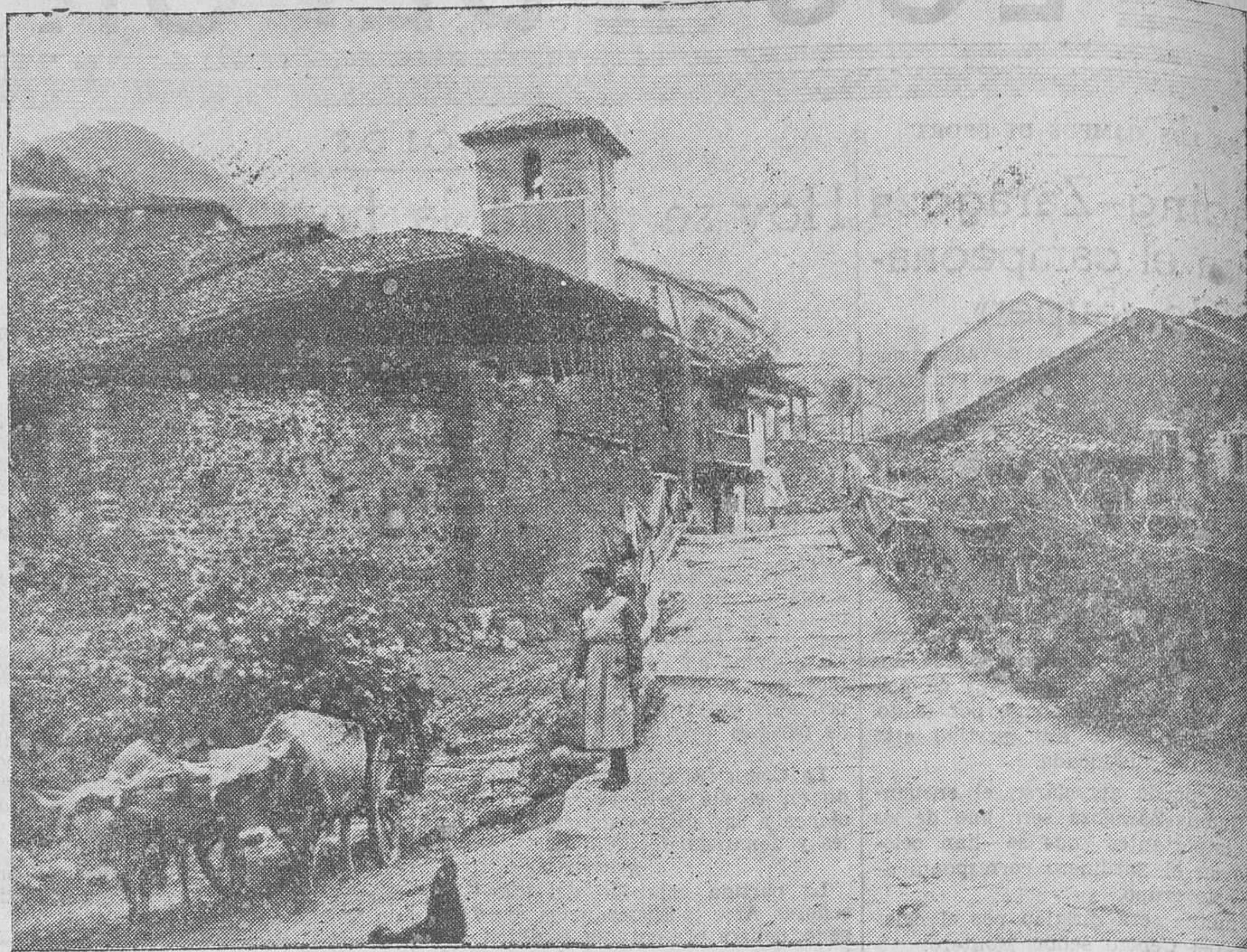
ESPINAMA - EL PUENTECILLO DEL PUEBLO