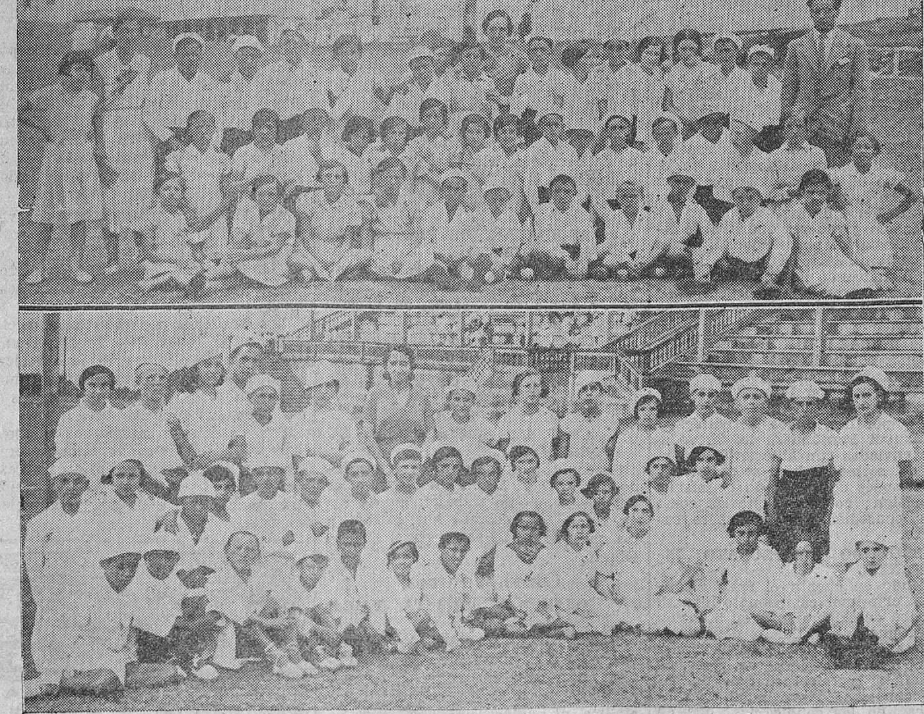
UNA GRAN LABOR SOCIAL.— Los niños y niñas de Los Corrales de Buelna, de Soria y de Avila, que forman las colonias de intercambio en Bella-Vista, acompañadas de sus profesores.