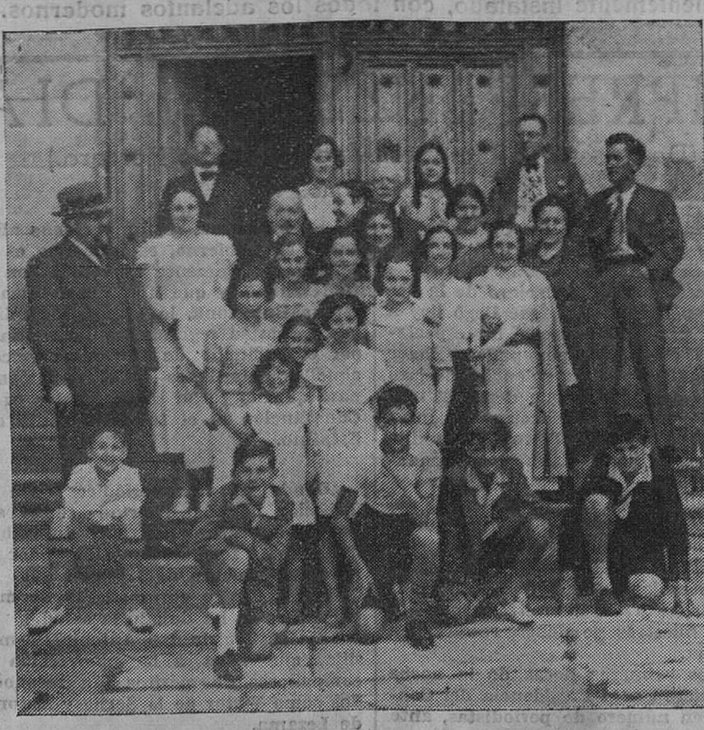
Profesores y alumnos del Conservatorio provincial de Música de Santander, que el lunes realizaron una excursión a Comillas y otros pintorescos lugares de la provincia.