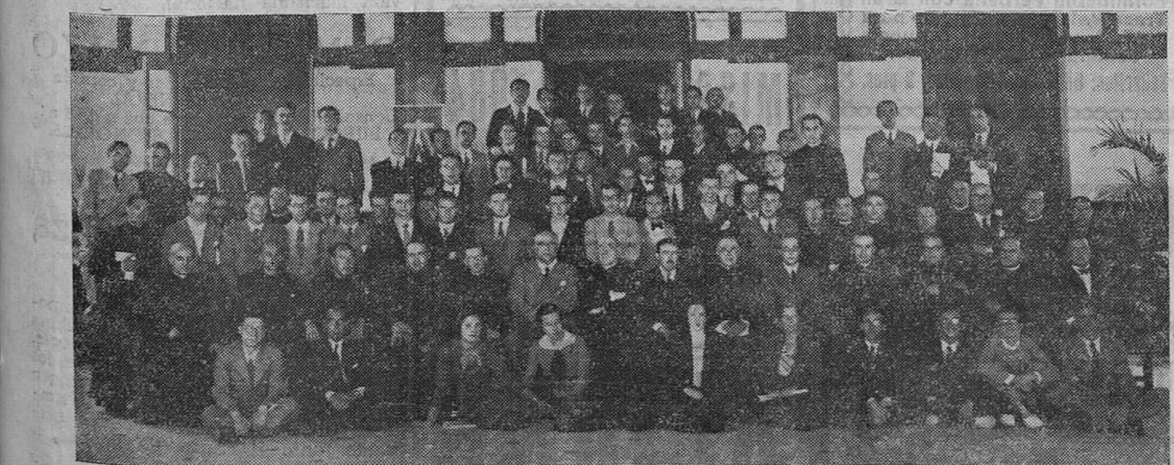
LA UNIVERSIDAD CATOLICA DE VERANO. — El sábado concluyeron los cursillos correspondientes a la primera quincena de julio, en el Colegio Cantábrico. He aquí un grupo de alumnos y profesores que asistieron a sus clases.