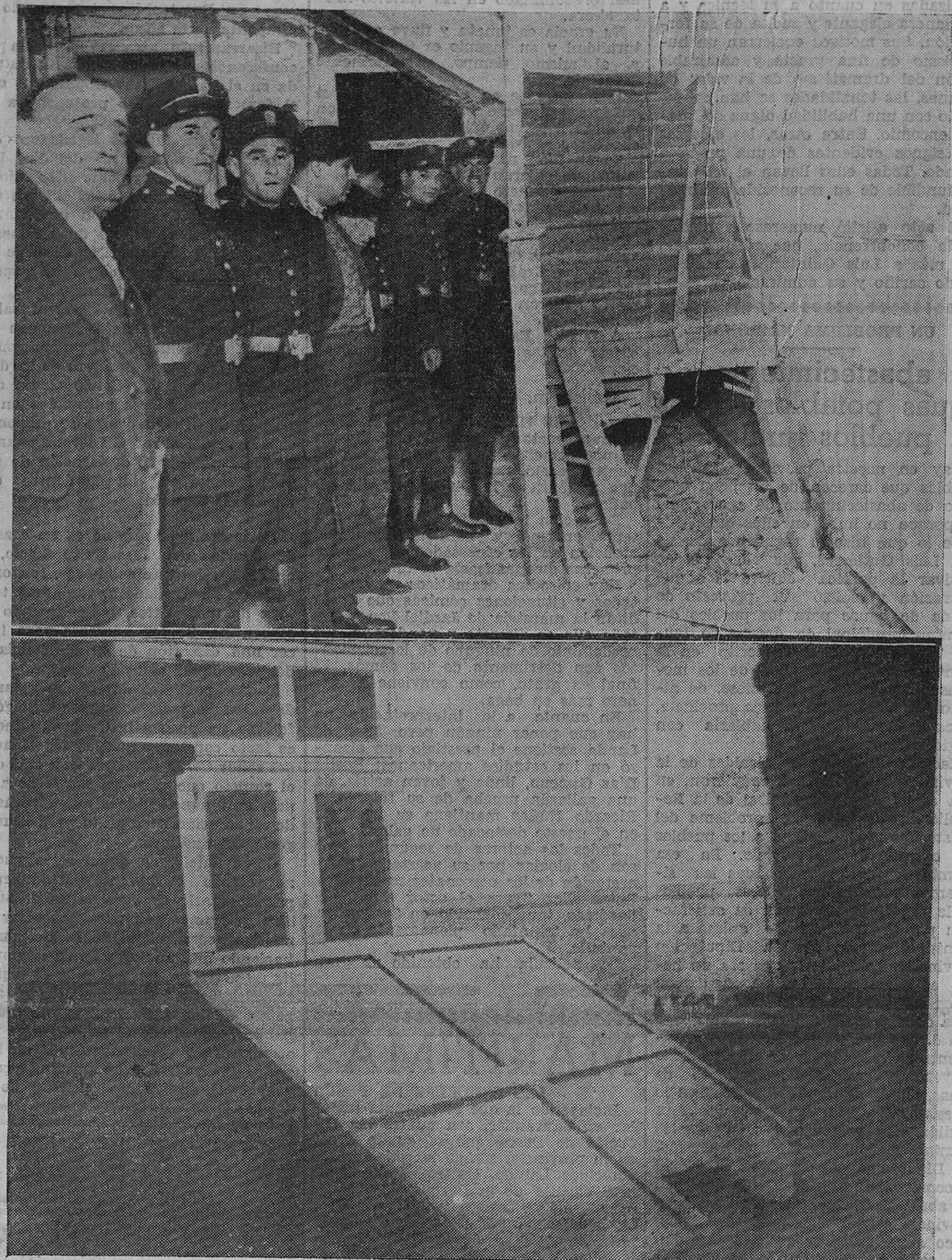
DE LA EXPLOSION DE ANOCHE. — Estado en que quedó la escalera después de la explosión. — Una mampara destruida por el artefacto.