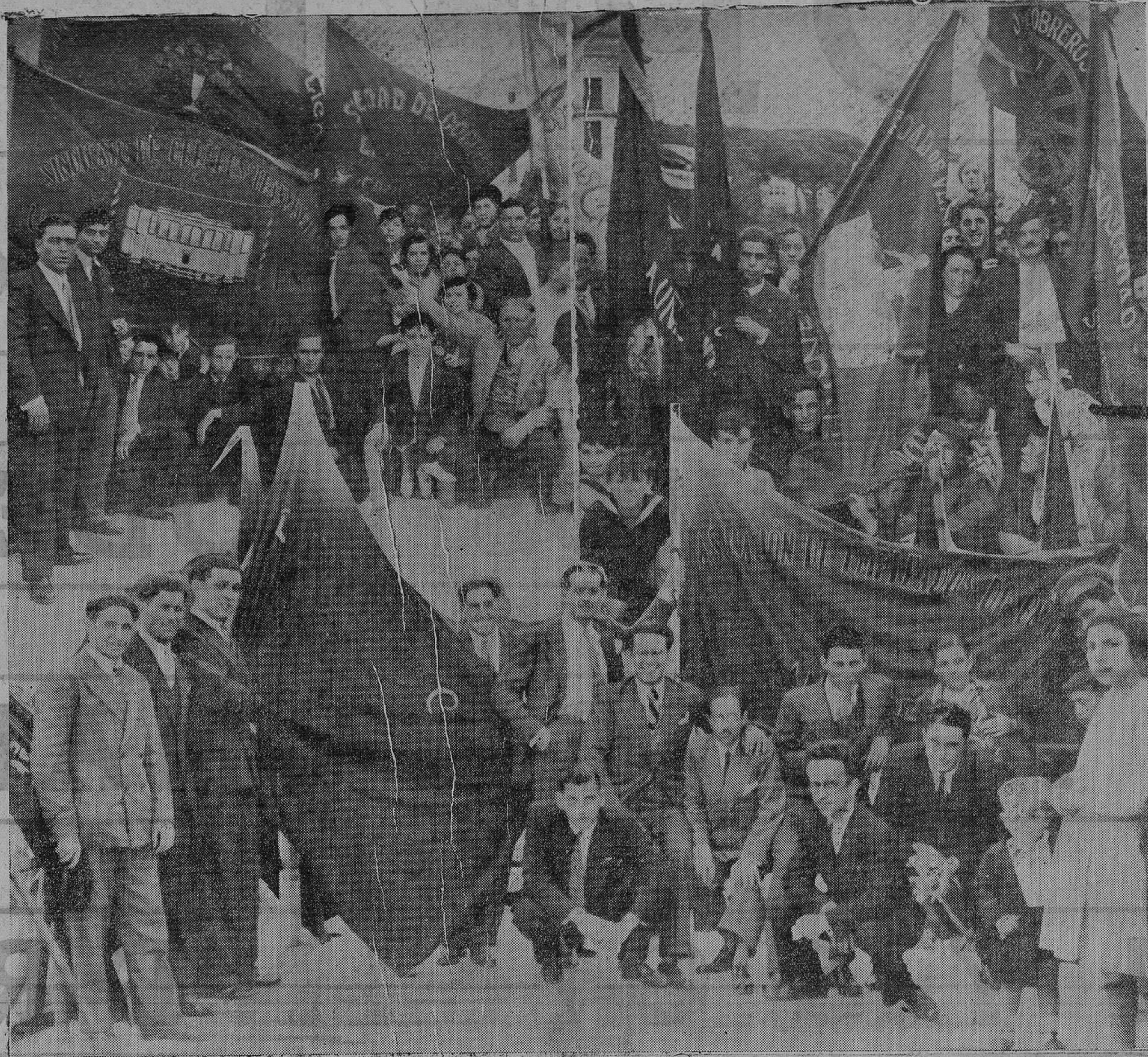
LA FIESTA DEL TRABAJO EN SANTANDER. — Algunas de las banderas que figuraron por vez primera en la jira de los trabajadores al Sardinero.

Orquesta como para el Orfeón «Pablo Iglesias» hubo, por parte de la muchedumbre, clamorosas ovaciones.