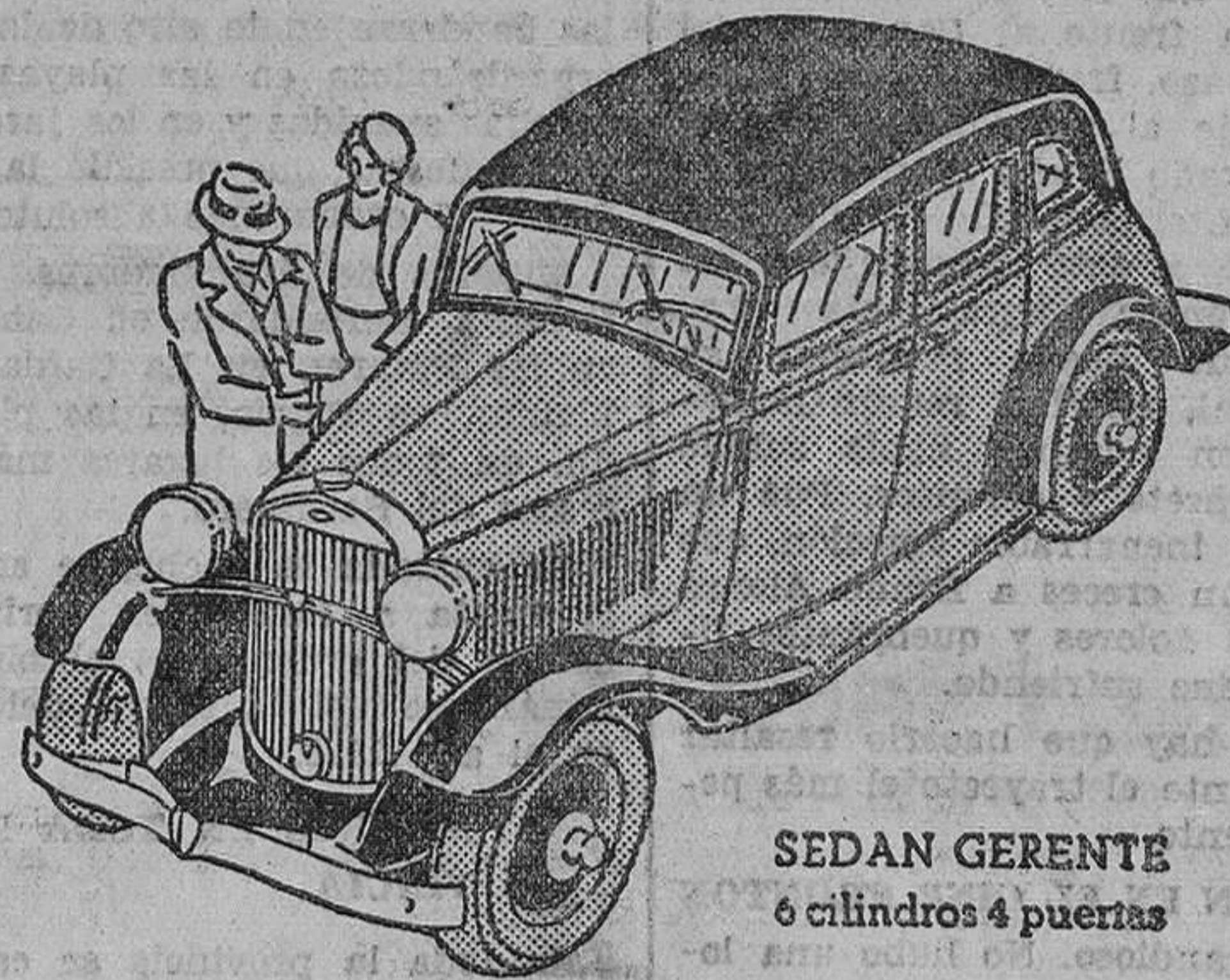
SEDAN GERENTE 6 cilindros 4 puertas

Once, son los modelos, incluyendo los cuatro de la serie Gerente de lujo, entre los que puede usted escoger. De estilo moderno, — perfectamente acabados — las carrocerías de madera dura y acero son