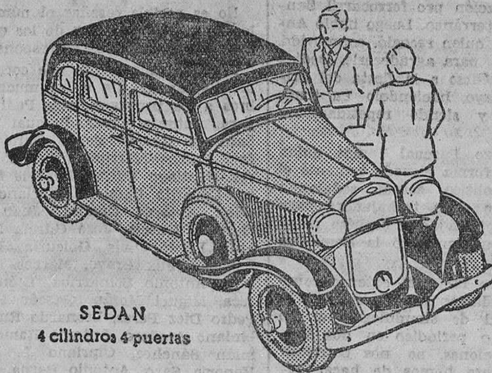
SEDAN 4 cilindros 4 puertas