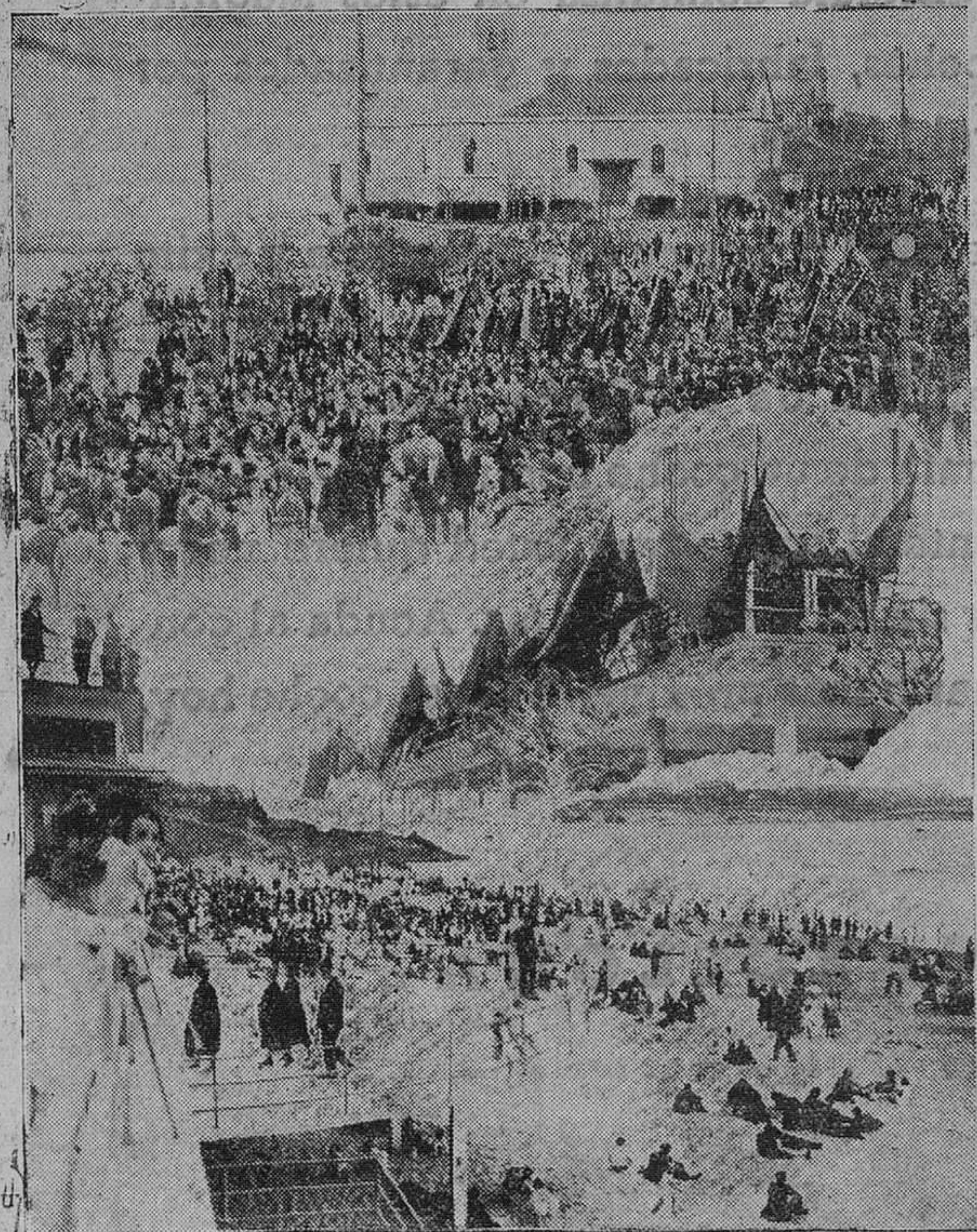
LA FIESTA DEL TRABAJO EN SANTANDER. — Las banderas de las Sociedades, al llegar al Sardinero, fueron colocadas en la terraza de la primera playa.