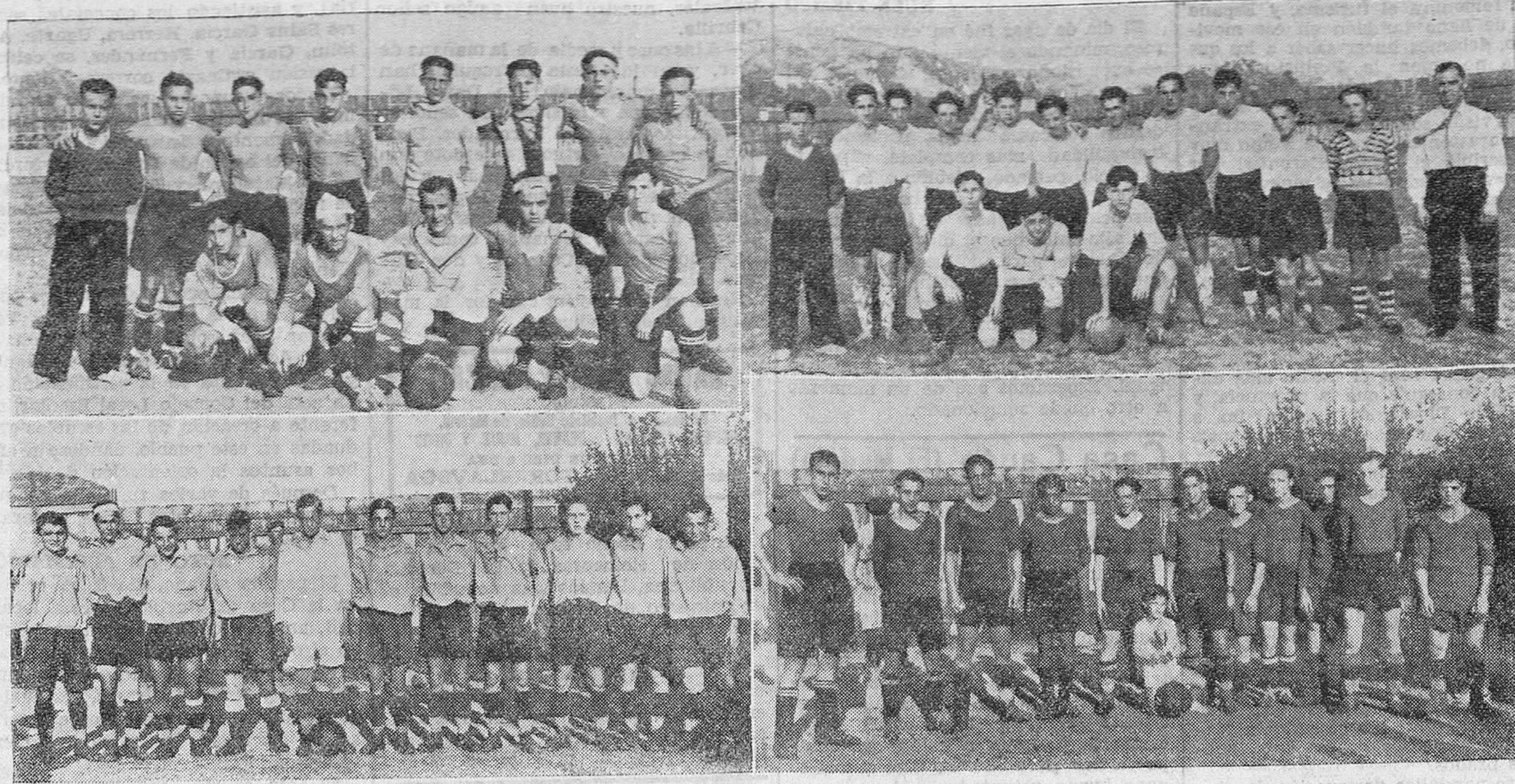
LA FINAL DEL CAMPEONATO DE CLUBS MODESTOS, JUGADA AYER, EN LOS ARENALES.—LOS EQUIPOS INVENCIBLE, ESPAÑOL, MAGDALENA Y TRIUNFO, QUE SE DISPUTARON EL MISMO.