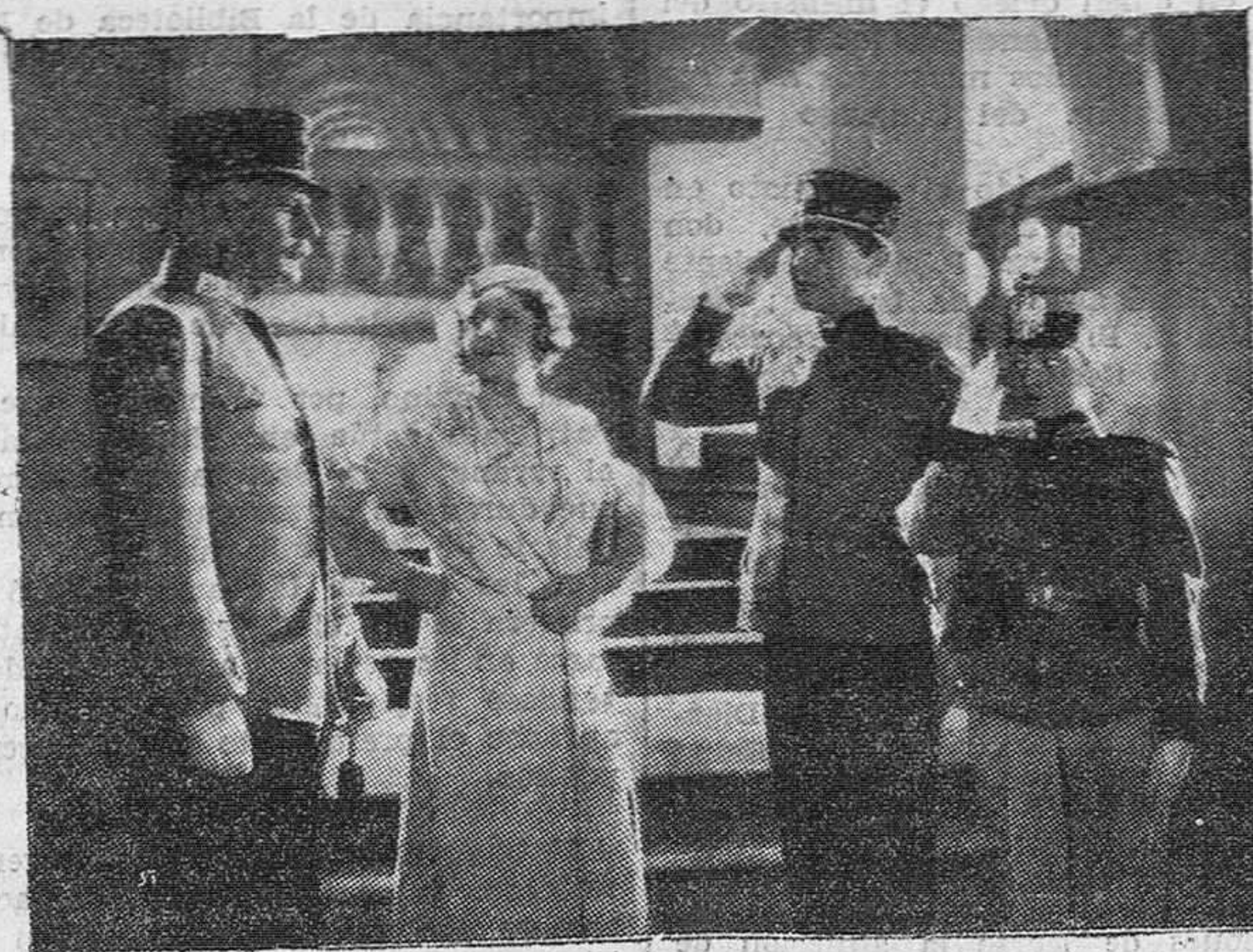
En el Teatro Pareda obtuvo ayer un gran éxito la preciosa película «El teniente del amor». Hé aquí una de sus más interesantes escenas.