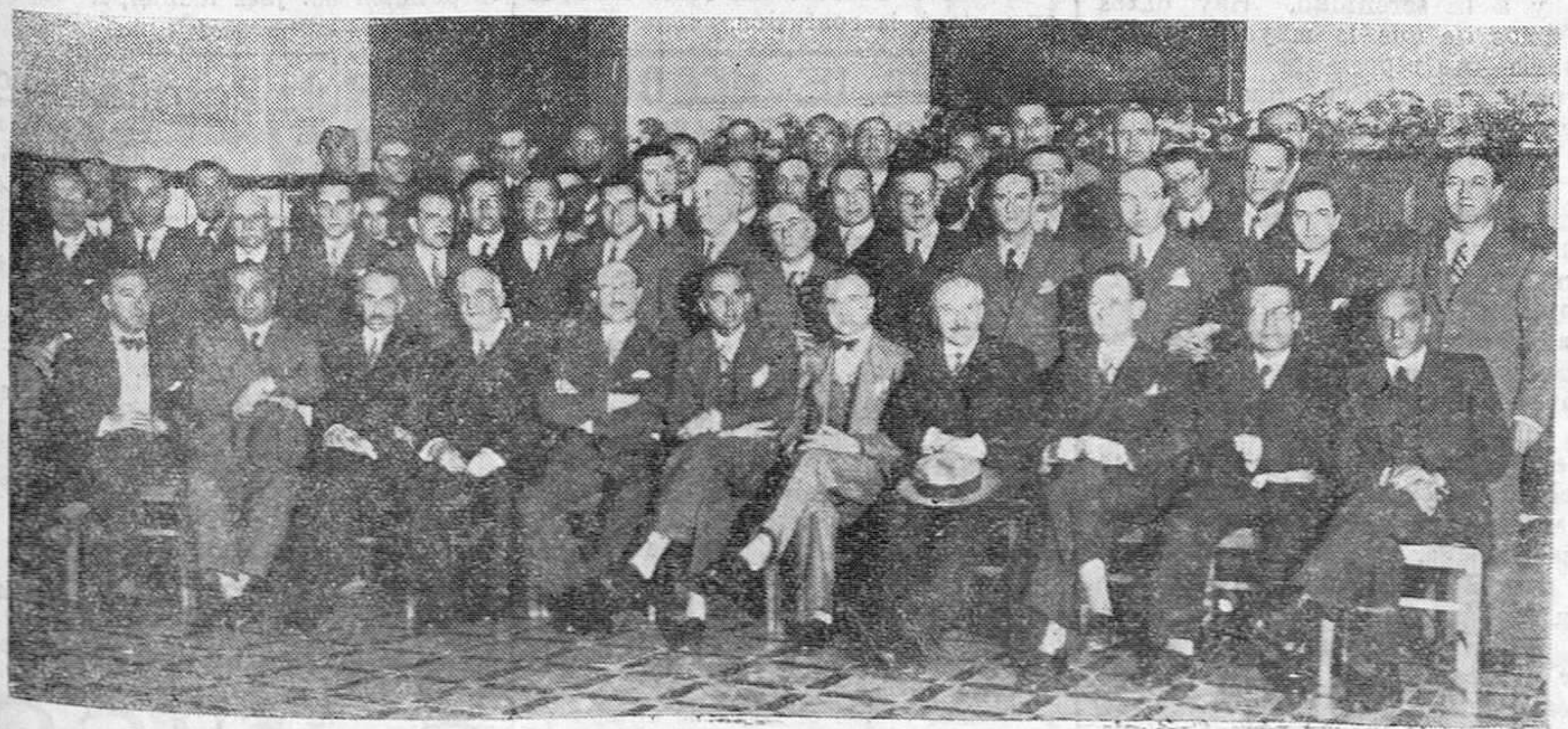
LA ASAMBLEA OFTALMOLOGICA. — Los distinguidos asambleístas, en la primera sesión celebrada ayer tarde en la Casa de Salud Valdecilla.

REBOLLEDO.—CORONAS DE FLORES.—TELEFONOS 2553 Y 4739.