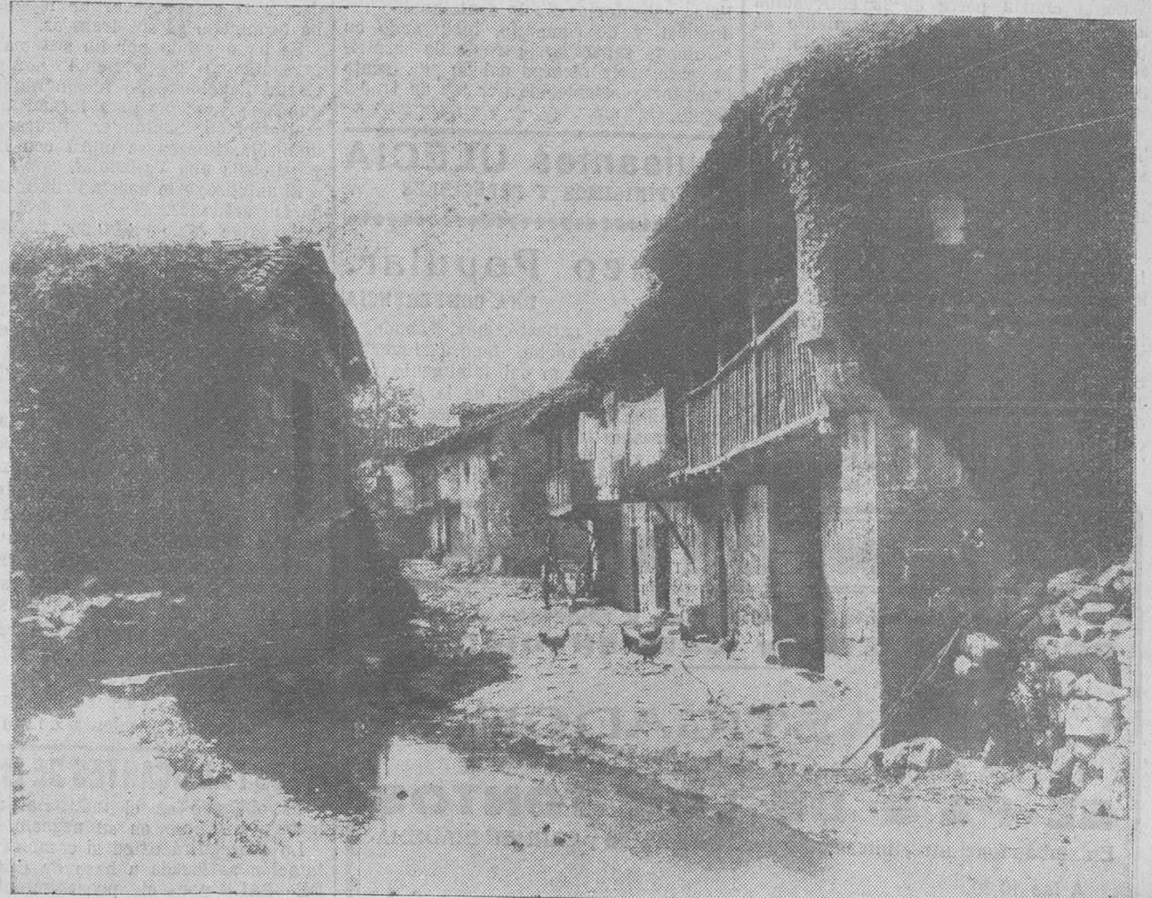
PRECIOSO PAISAJE DE BARGENA, TOMADO POR NUESTRO COMPANERO "SAMOT".

REBOLLEDO—CORONAS DE FLORES—TELEFONOS 2553 Y 4739.