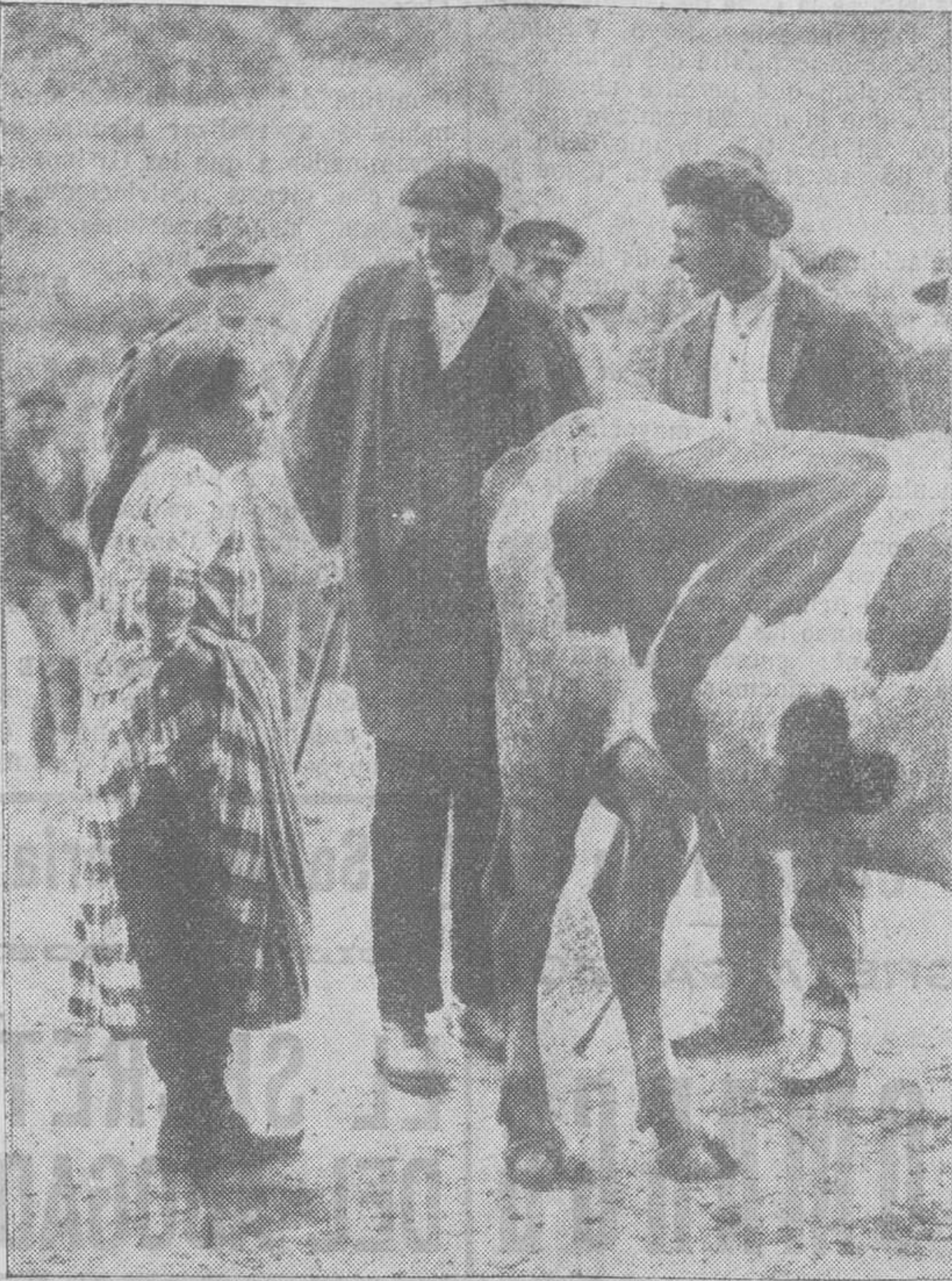
ESCENAS MONTAÑESAS. — Cerrando el trato para la venta de la "vacuca".