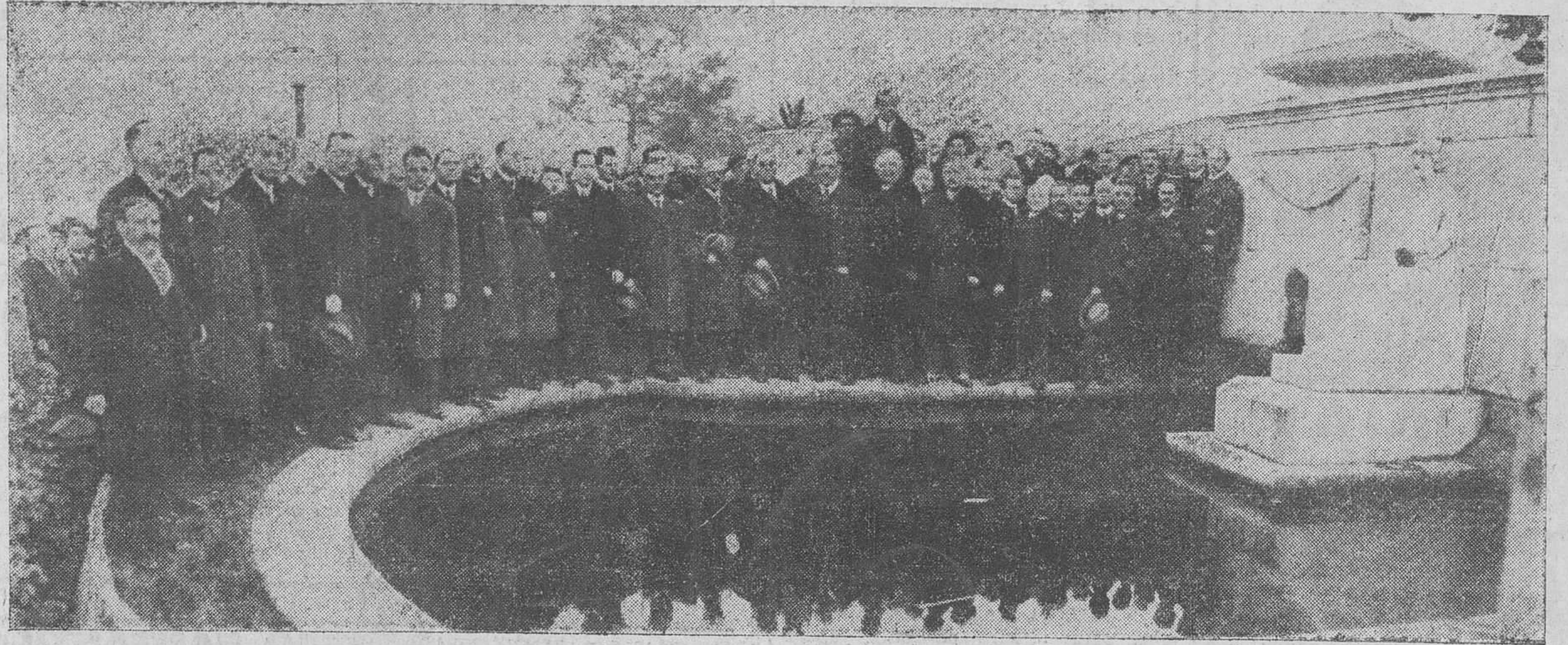
Los esplendidos cantores de Moravia, delante del monumento a la eximia escritora Concha Espina, a la que rindieron un homenaje de admiración y gratitud.

Partos. - Matriz. - Niños. - Cirugía general. TELEFONO 2419. Marcelino 5. de Sautvole, 2, 2. SANTANDER