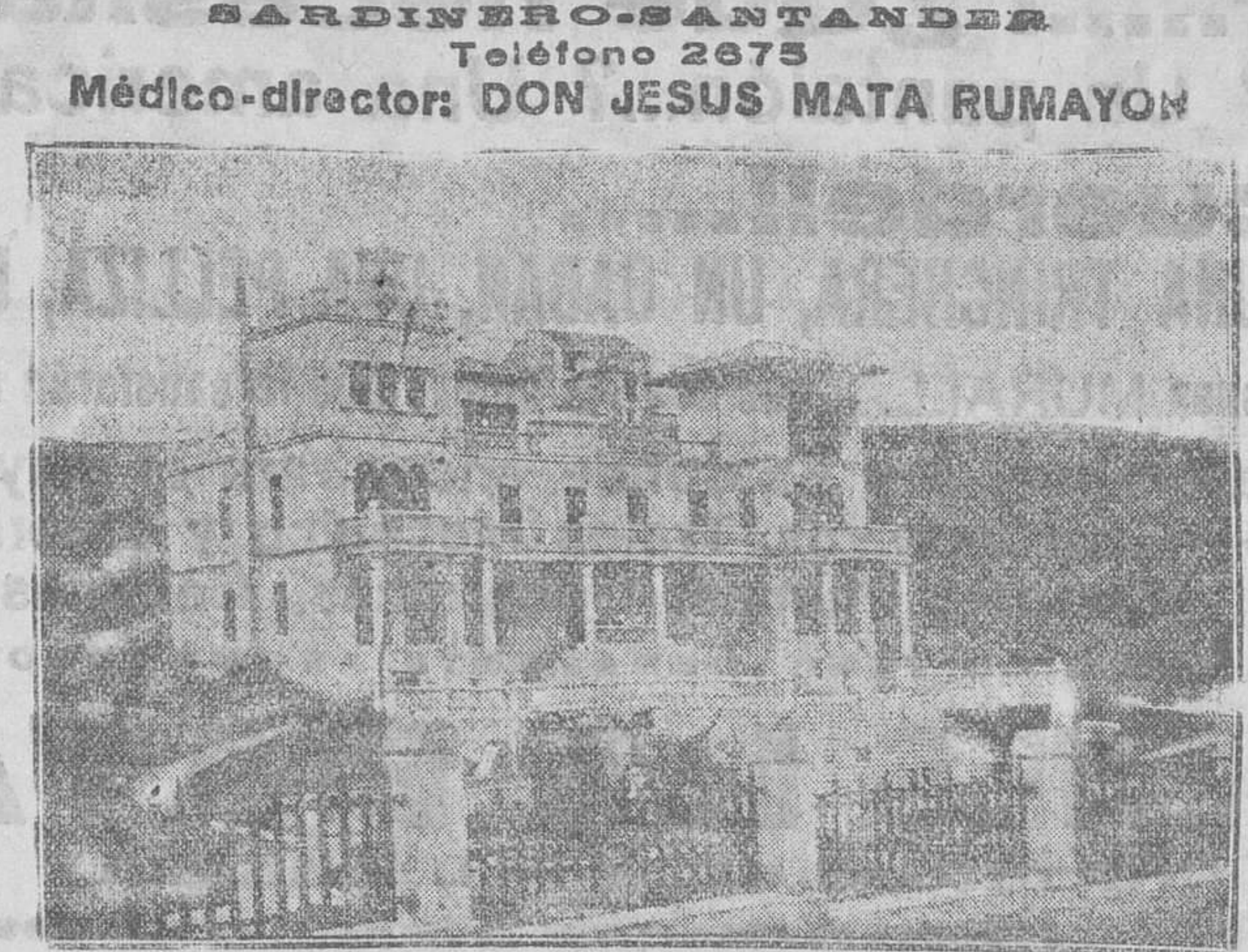
Este sanatorio está principalmente destinado a las enfermedades de los huesos, músculos y articulaciones...