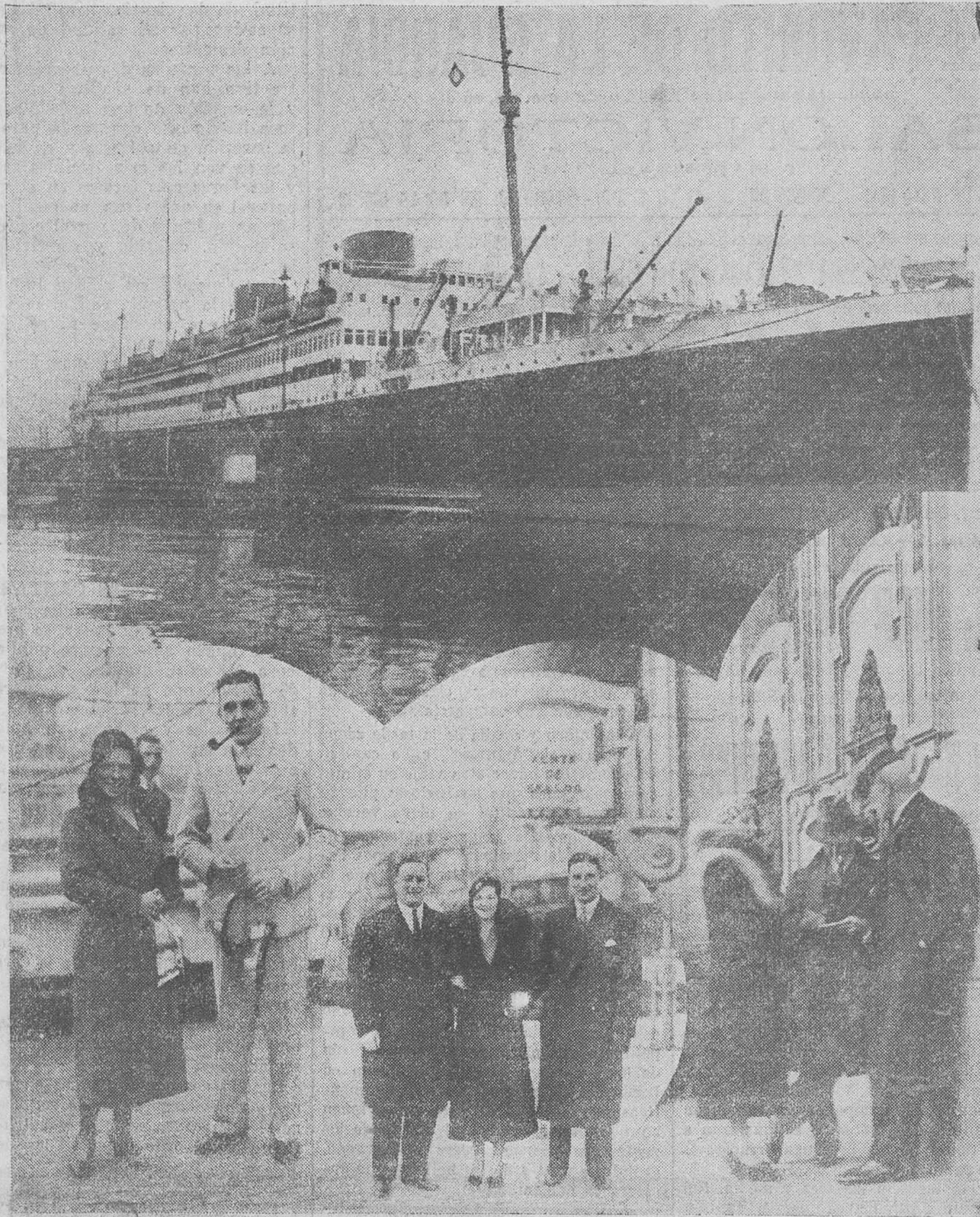
LOS TURISTAS INGLESES. — En la parte superior, el magnífico trasatlántico inglés "Asturias", que entró ayer en nuestro puerto con seiscientos turistas, procedente de Southampton. — Abajo, algunos excursionistas del barco, que animaron las calles de la ciudad. Como los lectores pueden ver, las mujeres inglesas no pueden ser más bonitas.

El regreso se realizará en las etapas conocidas; pero los aviadores