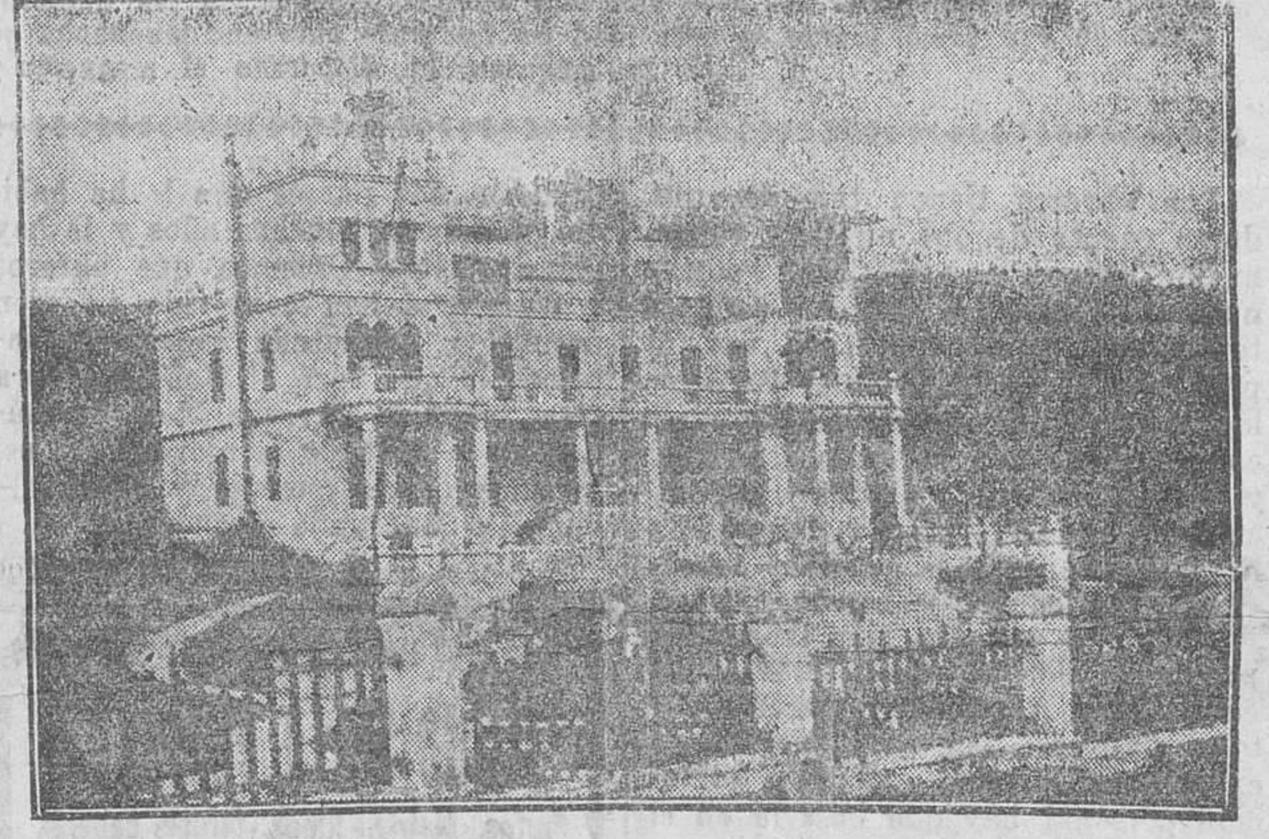
Este sanatorio está principalmente destinado a las enfermedades de los huesos, músculos y articulaciones en sus afecciones tuberculosas, siendo de inmejorables resultados en los estados pretuberculosos, enfermedades de la nutrición, raquitismo, etc., etc. Su bella situación, hermosa instalación y confort le hacen ser uno de los mejores de España.