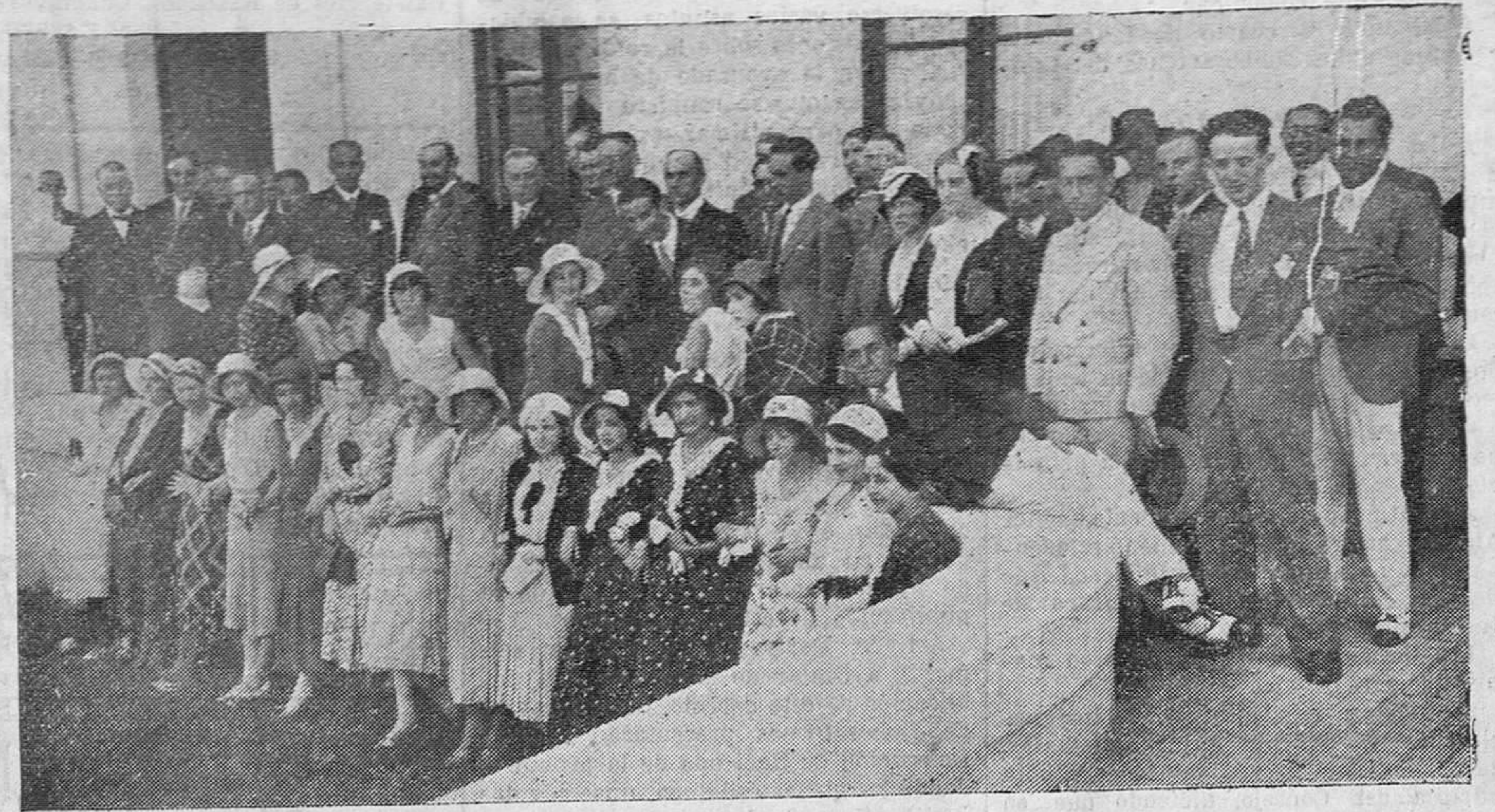
LA SEMANA FRANCESA. — Personalidades y jóvenes estudiantes franceses, en su visita a la Casa de Salud Valdecilla.

la excursión al Bañerío y Gran Hotel de Caldas de Besaya.