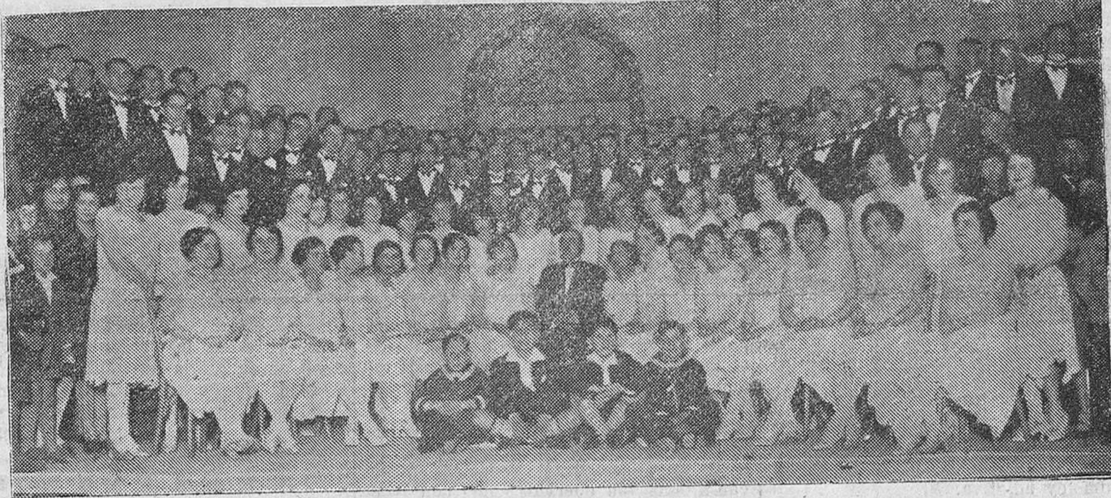
LA CORAL FILARMONICA PALEONTINA. — Interesante grupo de los simpáticos componentes de la Coral, que esta tarde llegará a Santander.

Partos. - Matriz. - Niños. - Cirugía general. TELEFONO 2419. Marcelino S. de Sautuola, 2, 2. o SANTANDER