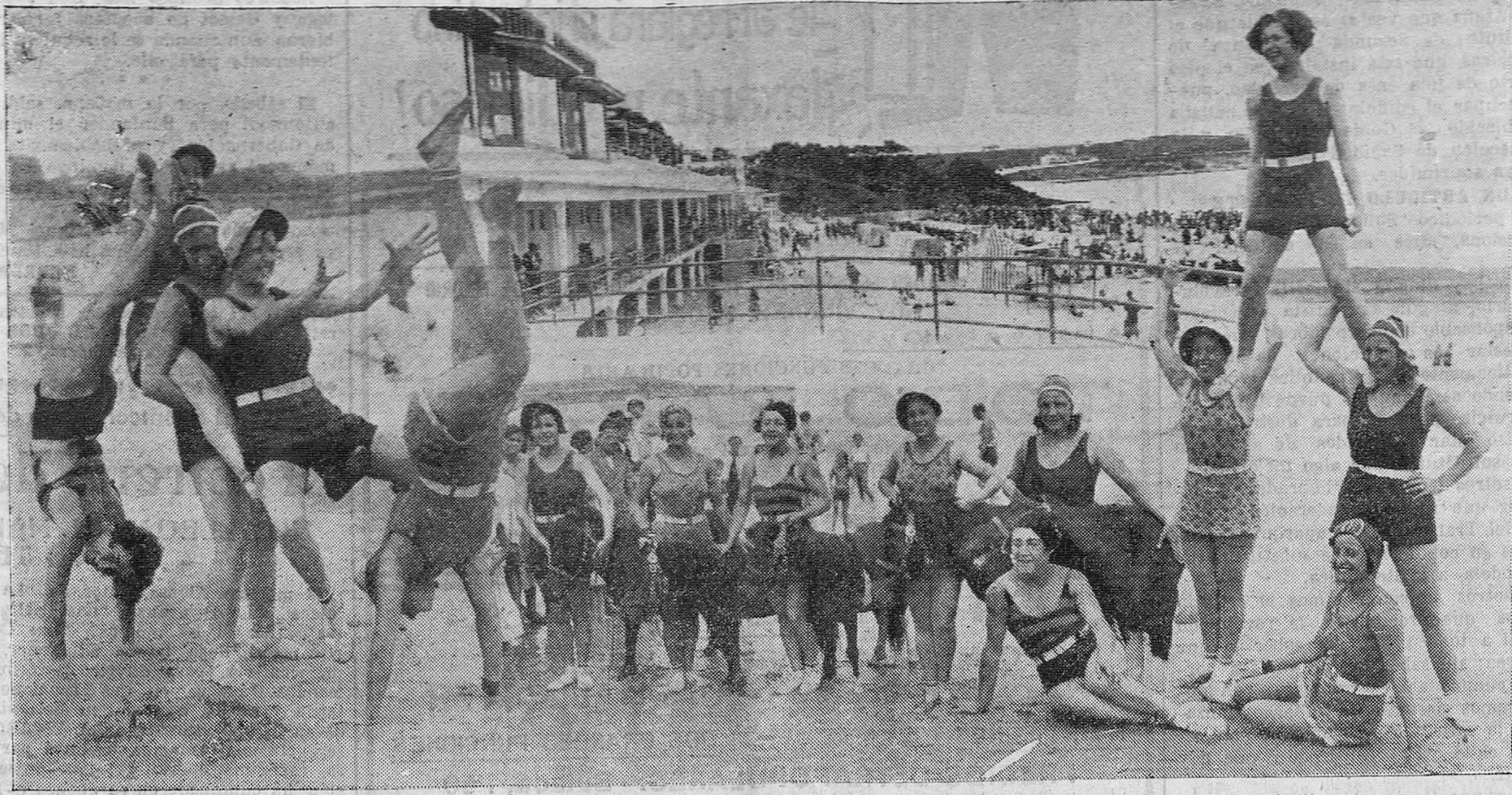
Con mujeres menos guapas que estas y con elementos menos originales que éstos, nos colocaría cualquier playa de los Estados Unidos un reclamo formidable en todos los periódicos de Europa. Santander, más modesto y sin presumir tanto, se conforma con reproducir esta foto en uno de sus periódicos locales. La playa está llena desde la terraza hasta el mar de preciosos todos, de niños y de mujeres. En un rincón juegan estas bellas muchachas con sus cachalitos que han comprado en Inglaterra y que parecen caballitos de cartón. Sin embargo, nosotros aseguramos que son de carne y que saben hacer muchas cosas que demuestran su clara inteligencia, superior a la de muchos hombres. Las muchachas, en plena diversión placentera, hacen equilibrios y pruebas circenses. Las personas mayores pasean y se bañan, los niños ríen, las olas refrescan el ambiente. "Samot" aprovecha el momento y tira la placa, que es un verdadero acierto fotográfico.

En esta empresa contarán, desde luego, con la colaboración de los pueblos interesados, que deberían ya