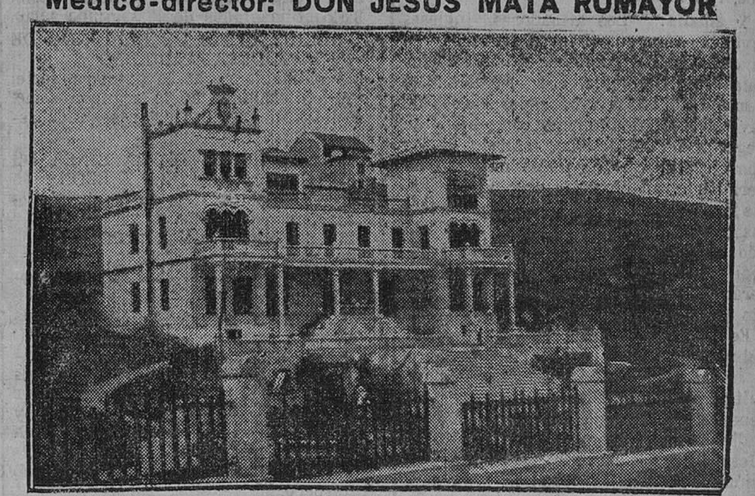
Este Sanatorio está principalmente destinado a las enfermedades de los huesos, músculos y articulaciones en sus afecciones tuberculosas, siendo de inmejorables resultados en los estados pre-tuberculosos, enfermedades de la nutrición, raquitismo, etc., etc. Su bella situación, hermosa instalación y confort le hacen ser uno de los mejores de España.