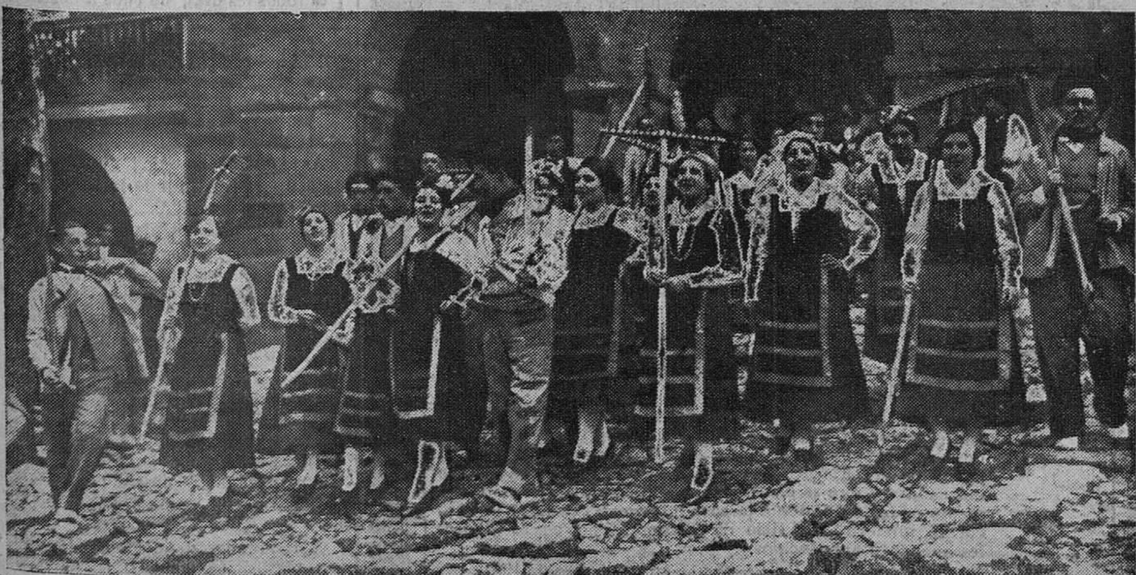
He aquí una bella escena de siega reproducida en la función de ayer, realizada en homenaje a la canción popular montañesa. Los mozos llegan fatigados de la dura brega del día; pero ello no les impide estar alegres y echar al aire una de sus canciones típicas, tan llenas de color y de ambiente.

Partos.-Matriz.-Niños.-Cirugía general. TELÉFONO 2419. Marcelino 5.º de Sautuola; 2.º SANTANDER