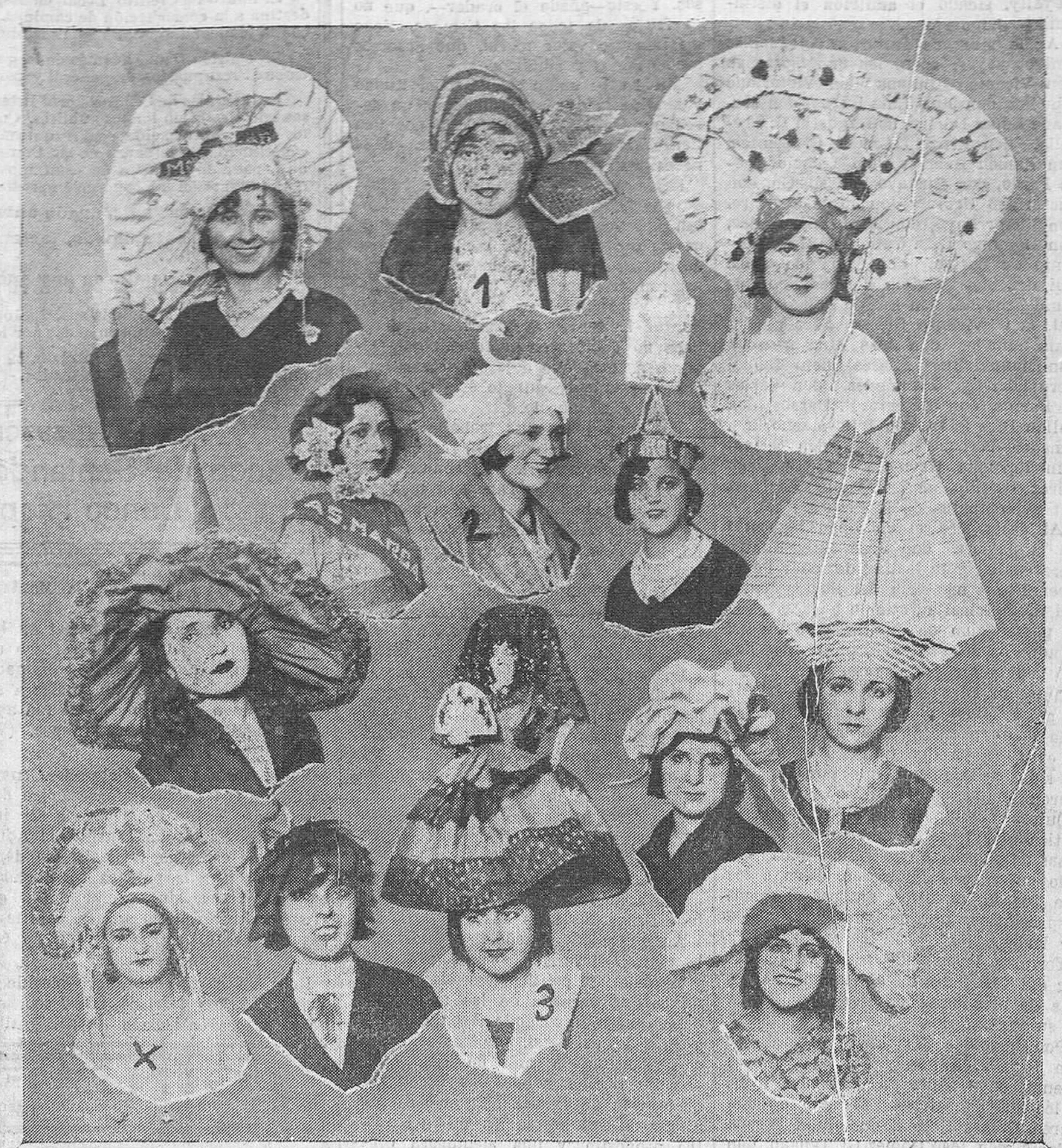
LOS DOCE MODELOS DE GORROS PREMIADOS. — Los señalados con los números 1, 2 y 3, obtuvieron el primero, el segundo y el tercer premio. El señalado con una X es el modelo de "La Parisienne", presentado fuera de concurso.