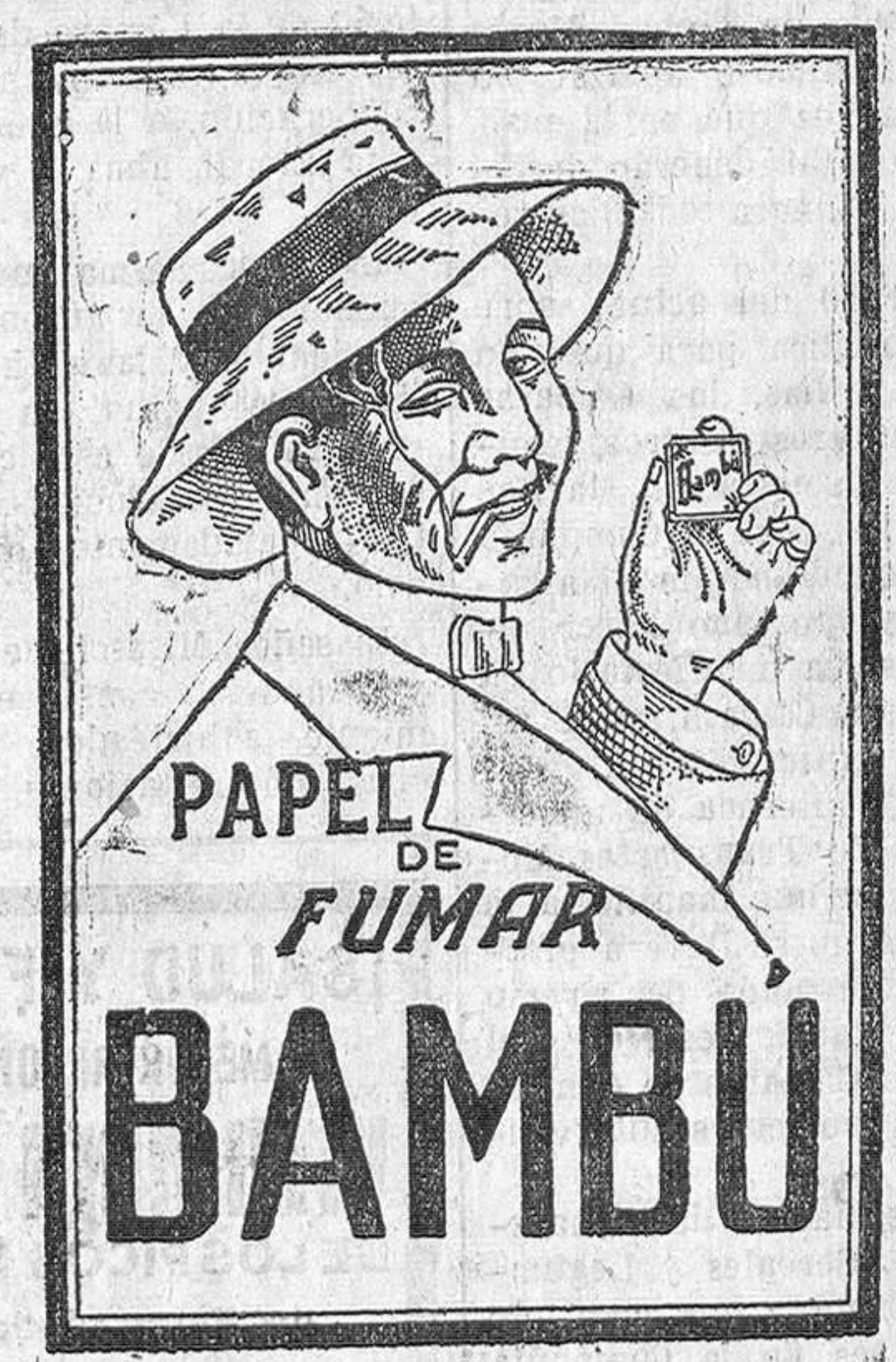
Ha obtenido GRAN PREMIO en la Exposición de Barcelona de 1929

Castro Urdiales LAS MODISTILLAS CASTREÑAS, POR SANTA LUCIA La simpática Comisión, cuyas egfies hubimos de admirar ayer en estas mismas planas, ha ultimado el programa para festejar a su Patrona, Santa Lucía, el próximo sábado, 13 de los corrientes.