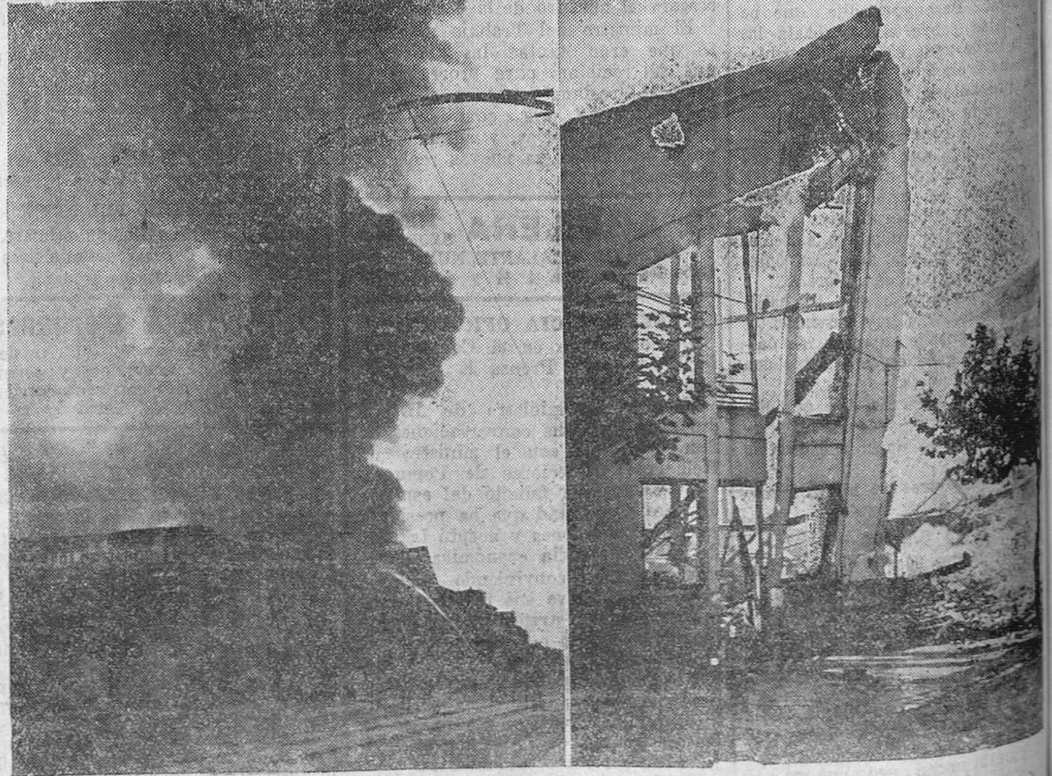
EL INCENDIO DE AYER. — Los bomberos, atacando el fuego desde distintos puntos.

Para muebles y tapicería, ALBA Talleres: Magallanes, 20. — Santander