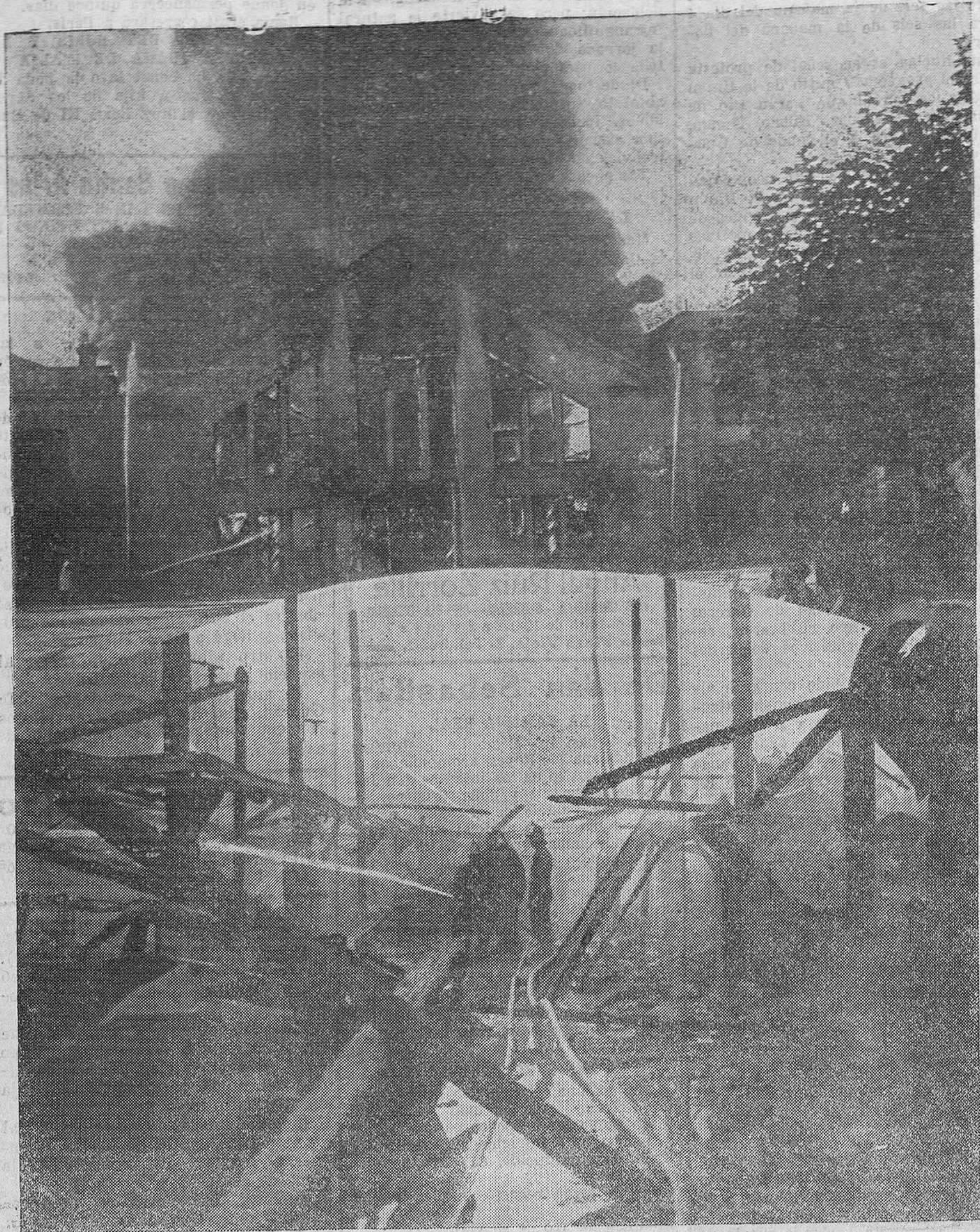
EL INCENDIO DE AYER. — El principio y el fin. — Las seis de la mañana, cuando el volcán lo está destruyendo todo. — Media hora más tarde, sólo quedan las ruinas del edificio en que la pared se desgaña y se estrella contra el suelo.

Las llamas eran tan grandes, que hubo momentos en que se temió que el incendio llegase a las casas de la calle de Méndez Núñez.