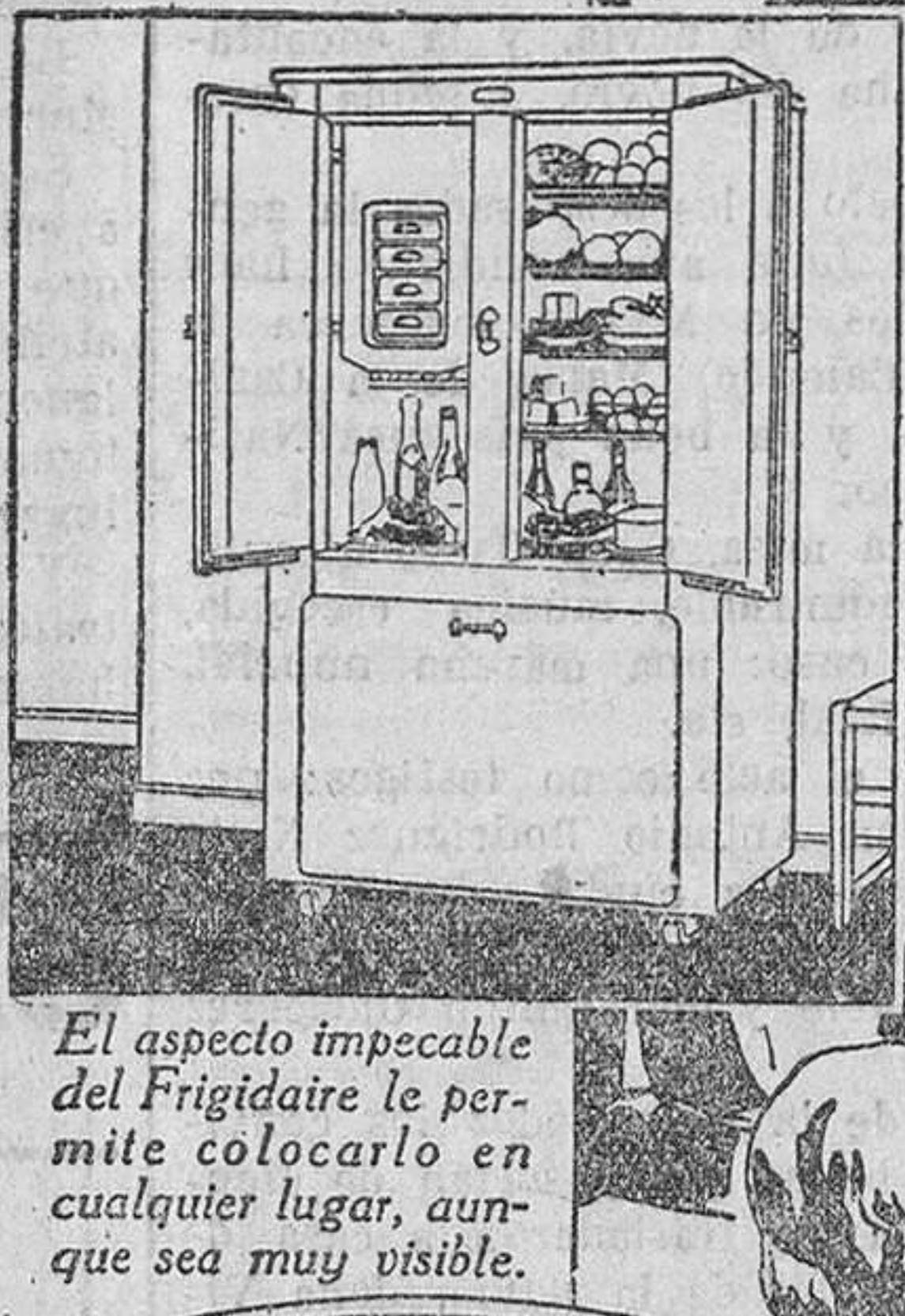
El aspecto impecable del Frigidaire le permite colocarlo en cualquier lugar, aunque sea muy visible.