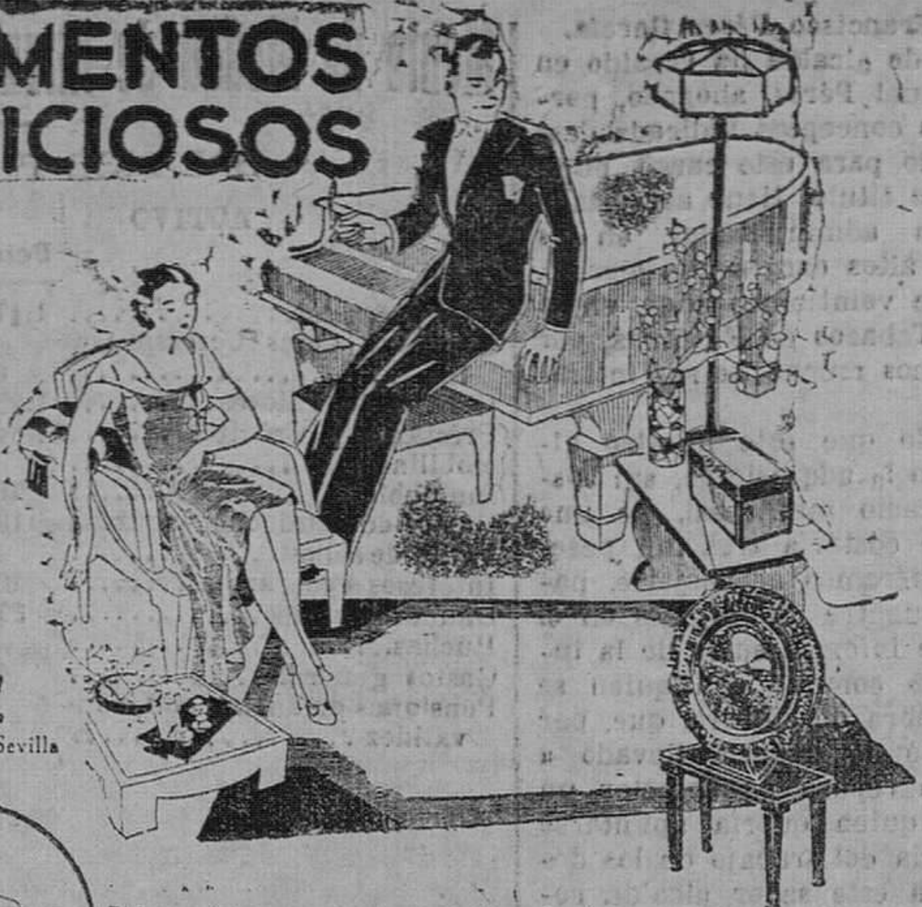
Visite el Stand PHILIPS en la Exposición de Sevilla