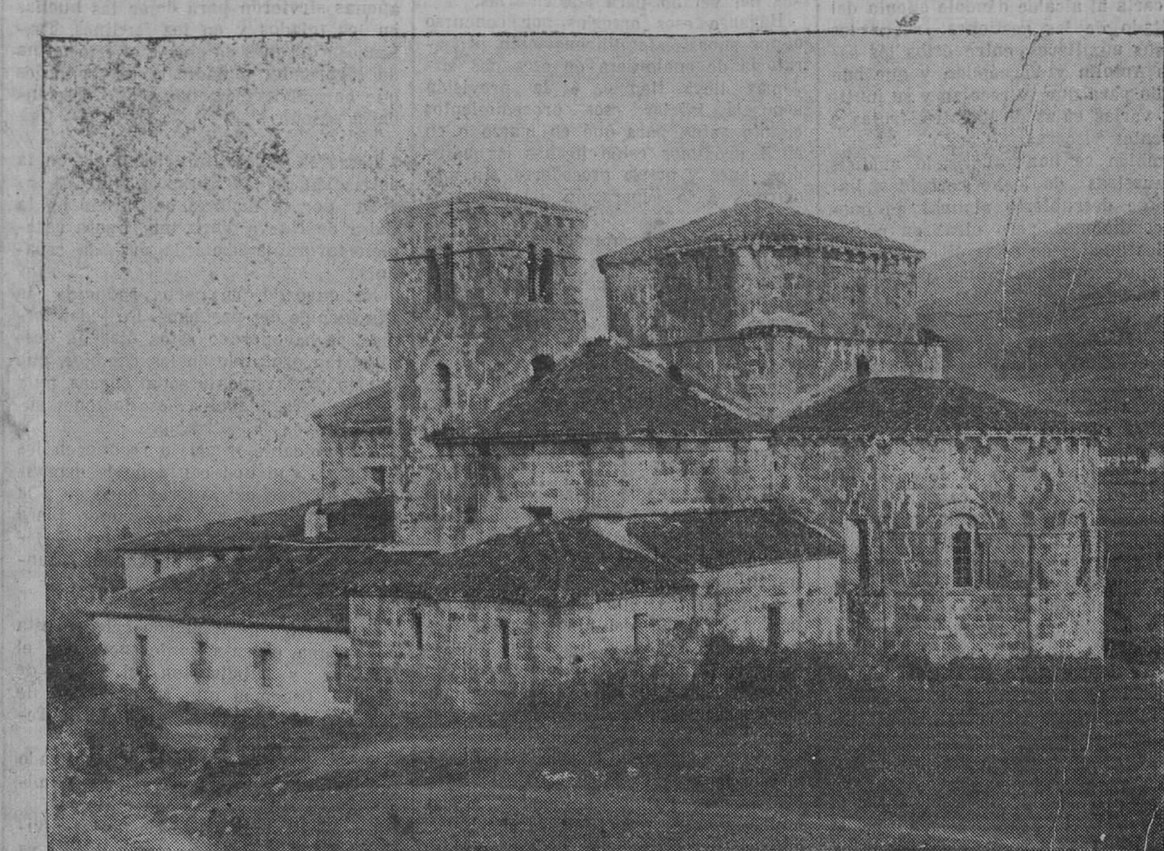
Entre las muchas bellezas arquitectónicas que guarda la Montaña, figuran las severas y magníficas colegiatas románicas como esta de Castañeda, verdadera joya de piedra a la que la pátina de los siglos ha hecho ganar en severidad y en belleza.