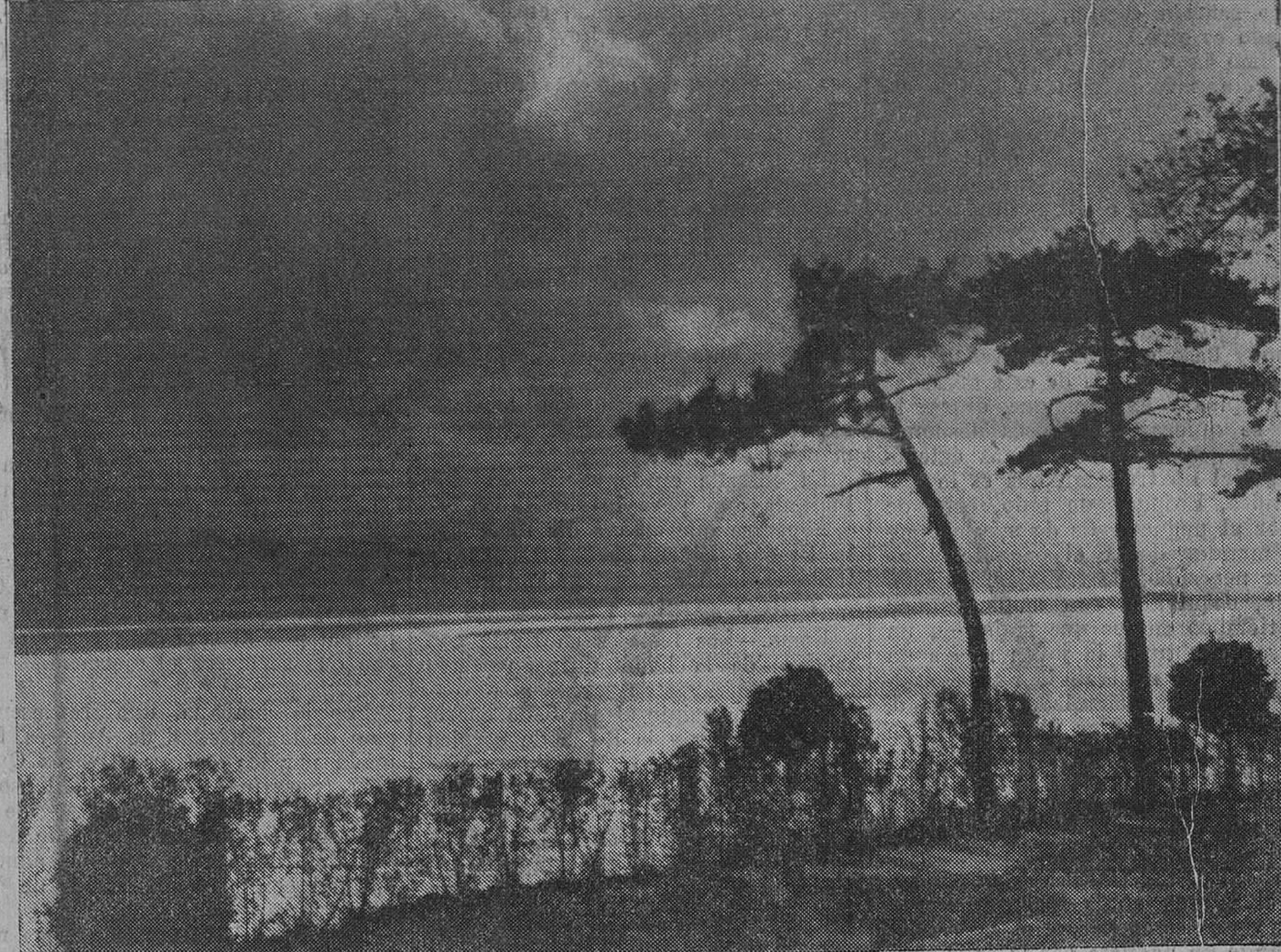
BELLO PAISAJE DE TARDE, EN NUESTRA BAHIA