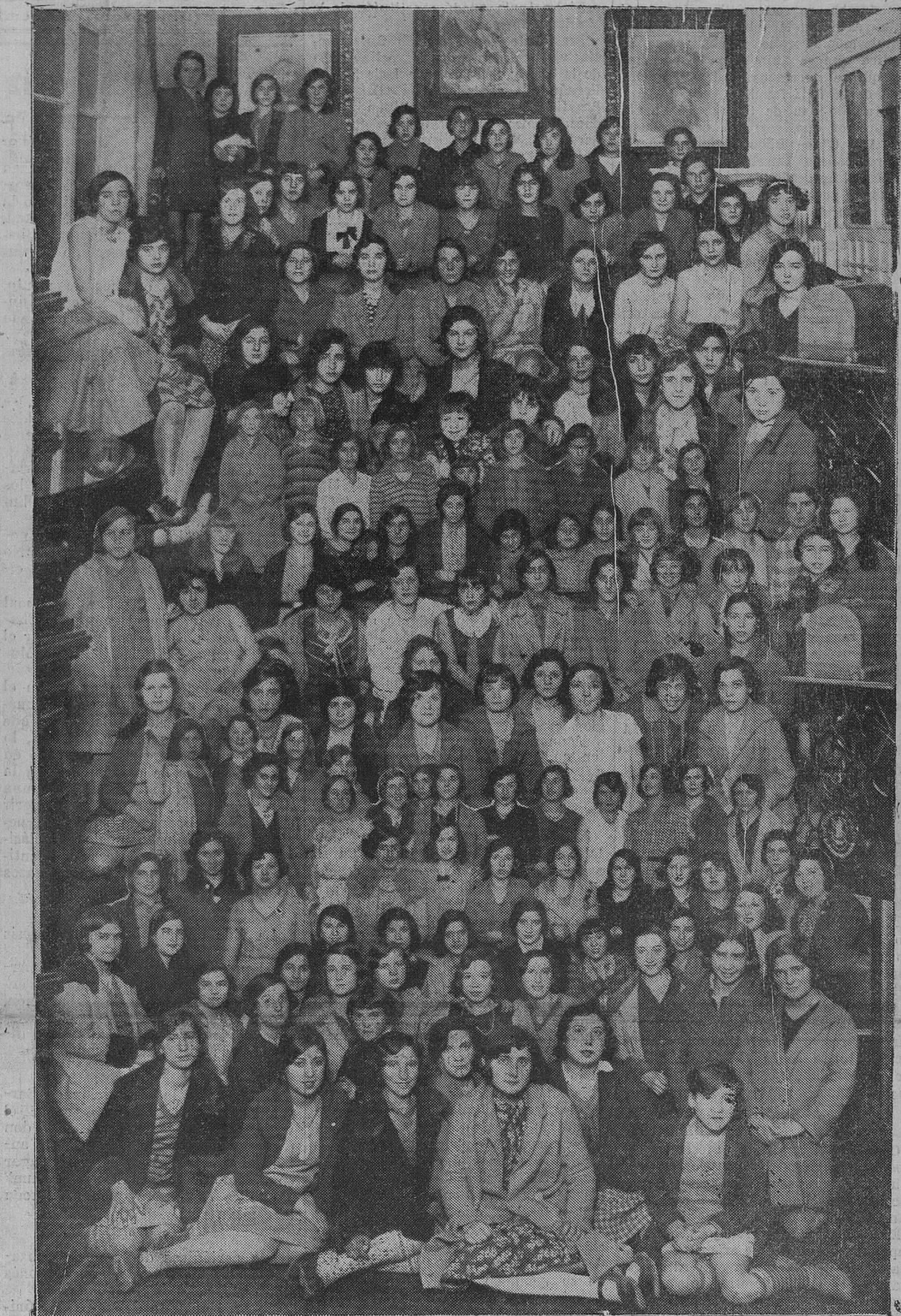
DESPUES DE LA FIESTA DE LAS MODISTAS. — Las simpáticas e inquietas aprendizas de los talleres de costura de Santander, que asistieron al sorteo de la magnífica máquina de coser regalada por los Almacenes de Ribalagayga, acto simpatísimo que se verificó en la Redacción de EL CANTÁBRICO.

Cortada la comunicación entre Barcenaciones y Carranceja, sólo existe el paso peonil por la vía entre las estaciones de Golbarro y Casar de Periedo, el cual, además de estar prohibido