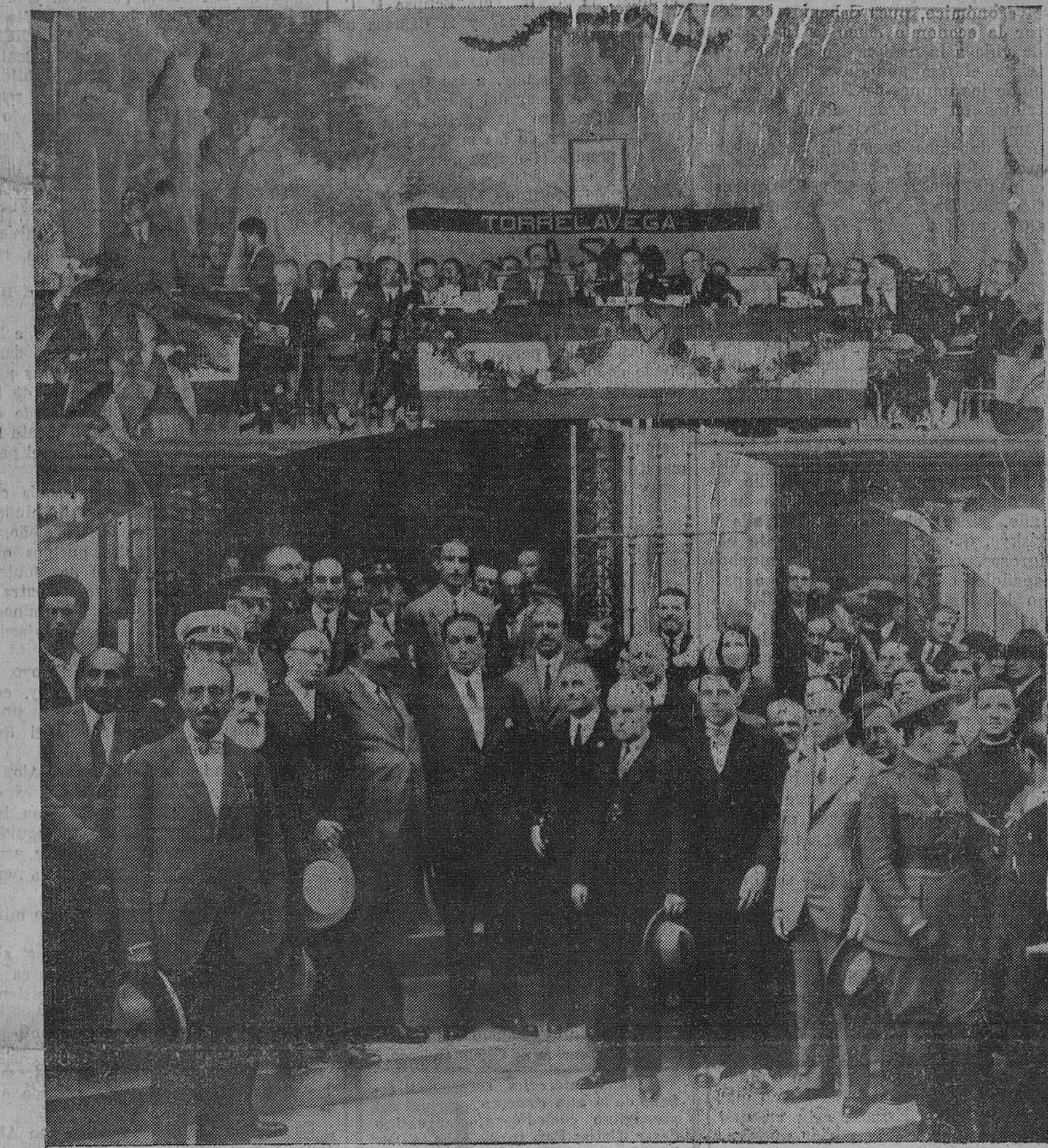
TORRELAVEGA. — La presidencia del mitin en el Teatro Principal, en el momento de hacer uso de la palabra el señor Cospedal. — El señor Calvo Sotelo y las autoridades, al llegar éste al Teatro, donde se celebró el acto.

La situación económica de España es, al presente, una situación perfectamente grave. La balanza económica de 1928 arroja un déficit de 800 millones de pesetas. Quiere decir esto que España, durante ese año, importó mercancías del extranjero por un valor superior en 800 millones a sus exportaciones. Entre esas partidas que señalan el déficit figuran las siguientes: Por mulas, doce millones de pesetas; por vacas y ganado lanar, ocho; por