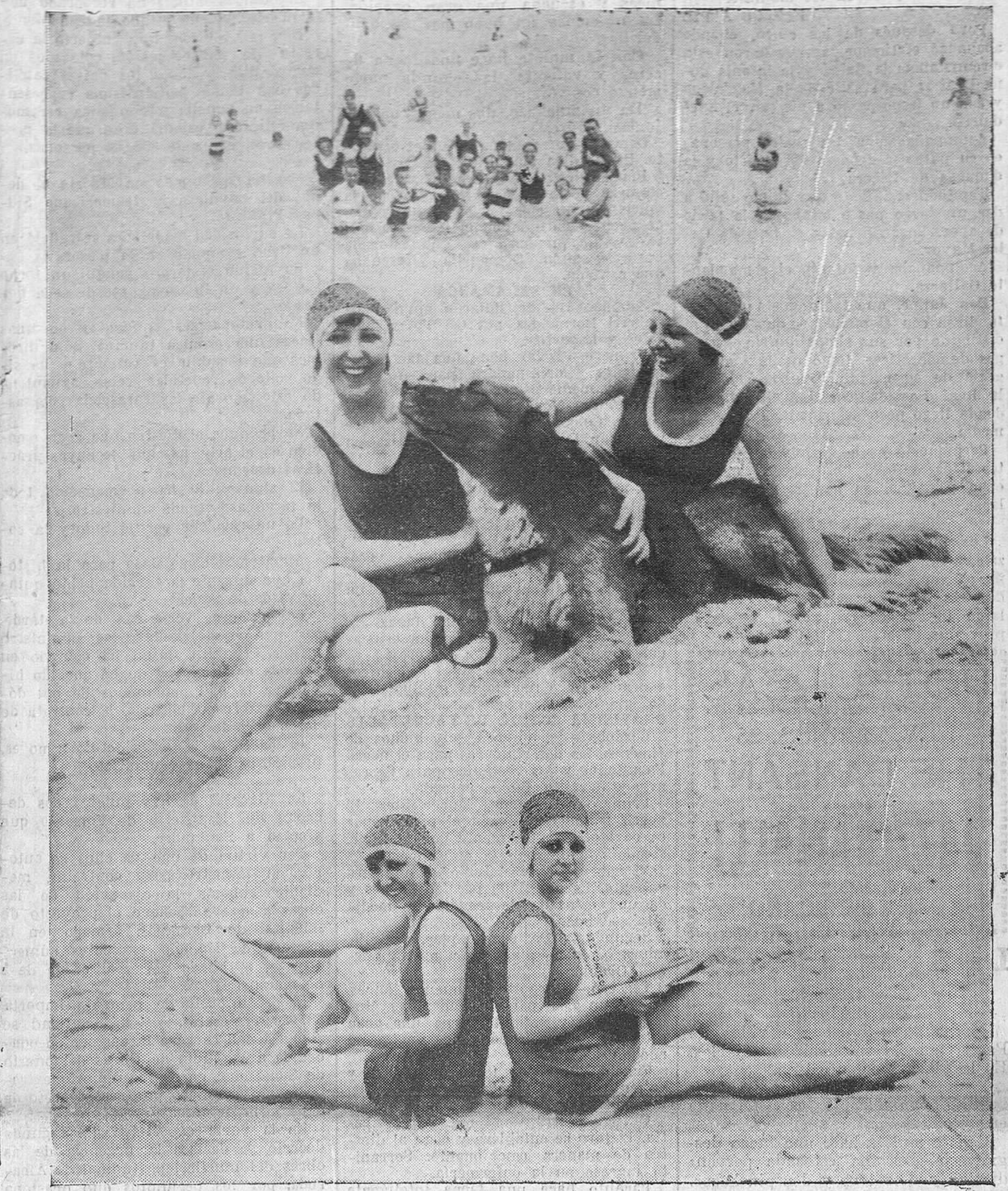
Nuestras playas, que rebosan de bañistas, son la actualidad permanente en la época estival, y hasta que los reporteros gráficos acudan a ellas cualquiera de estos días para que puedan recoger escenas tan sugestivas como las que hoy ofrecemos a nuestros lectores, en las que sobre el fondo maravilloso del mar destacan las espléndidas figuras de dos bellezas de las innumerables que son la mayor gala y ornato de las playas en las horas centrales de la mañana.

Este pequeño episodio, en apariencia insignificante, de descontento del Japon—de ser cierto, y de no mentir o estar equivocadas las Agencias que comunican la noticia—tiene una gran perspectiva de importancia. Esta importancia está en la historia de los pueblos de Asia y en las ambiciones que sobre ellos se proyectaron por las grandes naciones de Europa. Inglaterra realizó la conquista de la India en 1757, y en cerca de un siglo somete a su imperio a 250 millones de habitantes