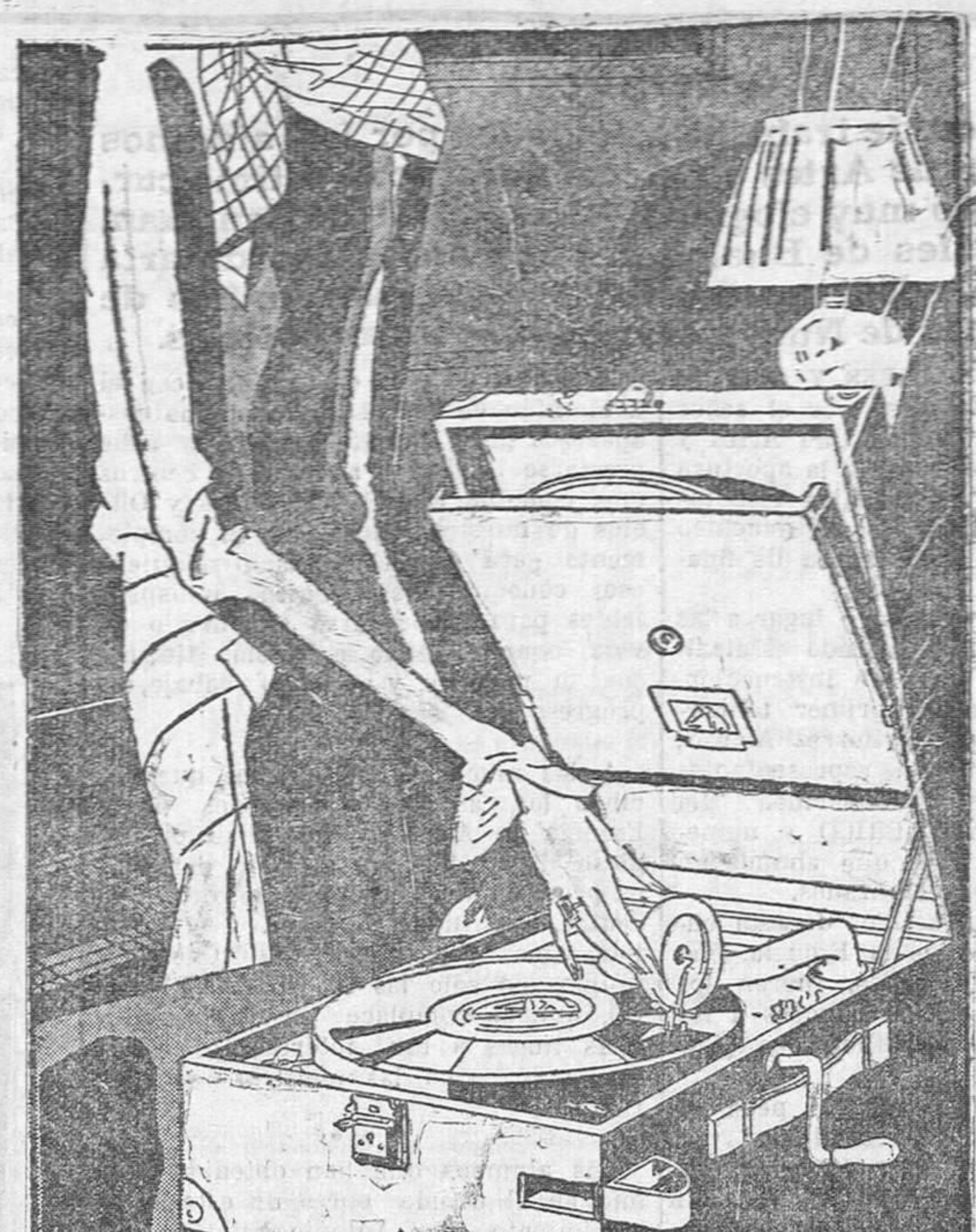
Modelo portátil núm. 101 en cuero negro