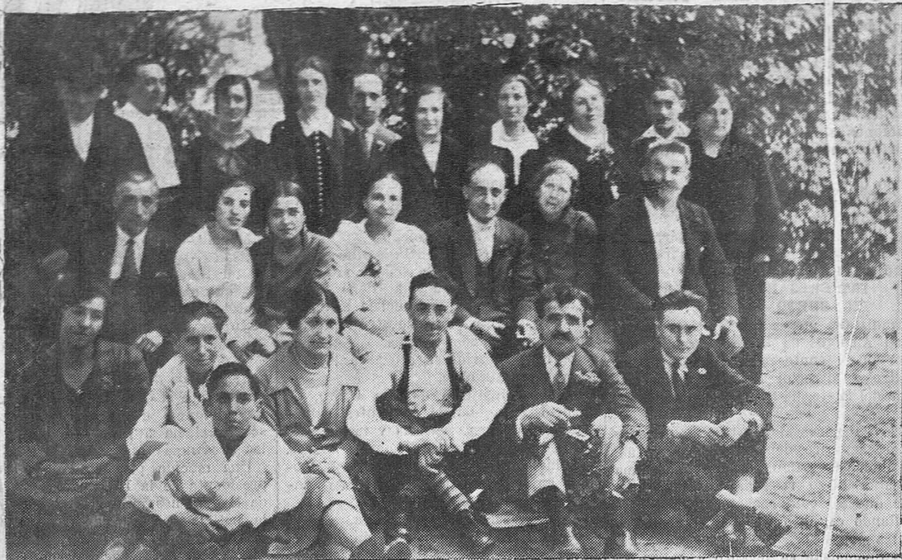
Grupo de excursionistas santanderinos que el pasado domingo visitaron la Fuente del Francés.