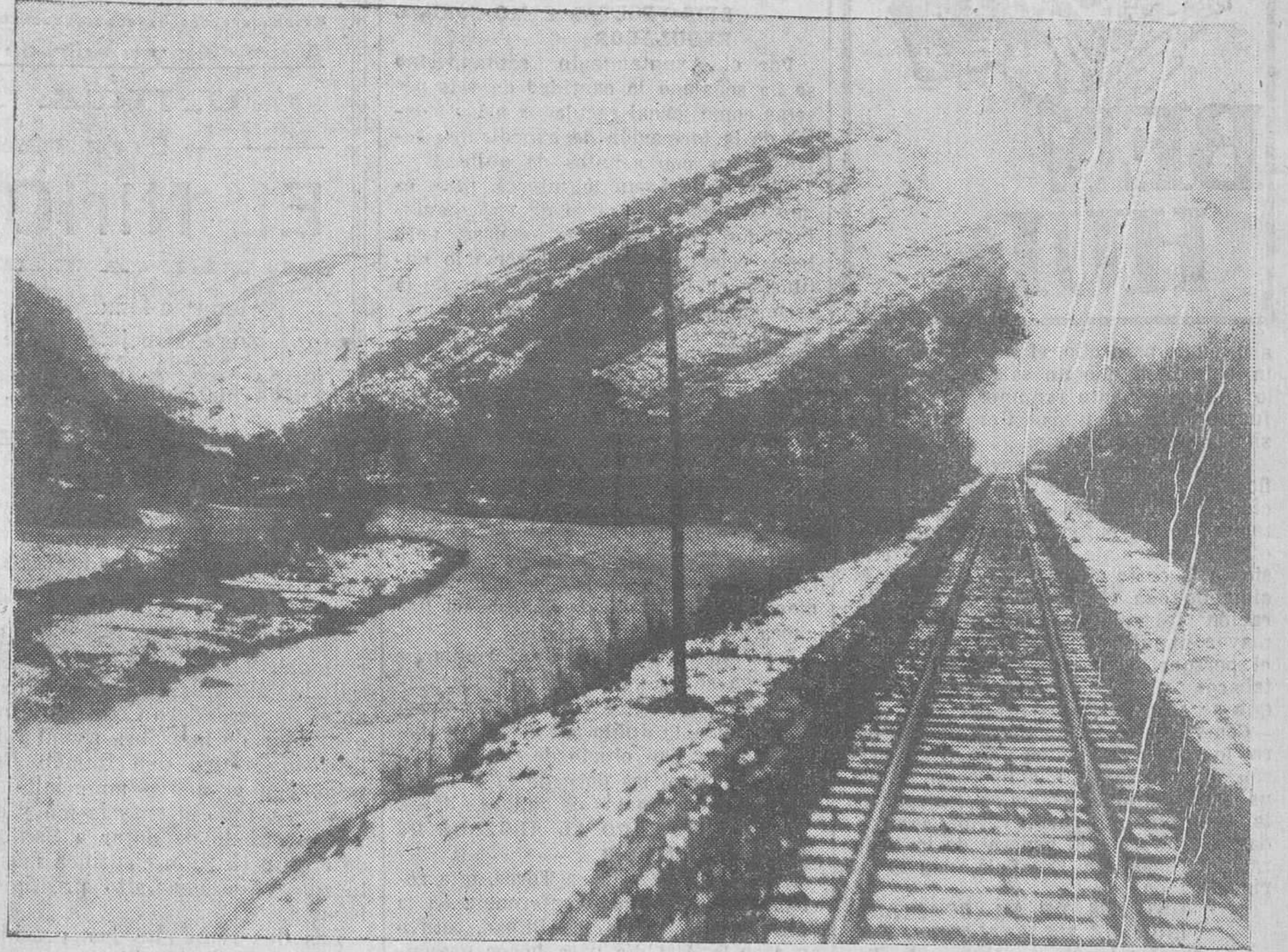
EL BESAYA, VISTO DESDE EL FERROCARRIL DEL NORTE. PASADO EL ULTIMO TEMPORAL DE NIEVES.

Es muy posible que no se limiten estas expediciones de turistas americanos a los viajes regulares de la Compañía inglesa del Pacífico. Si la afluencia de pasajeros fuera tan grande como se espera, la Empresa, que realiza incesantemente en Inglaterra una labor provechosa de propaganda de Santander para el turismo en el verano, la Compañía del Pacífico establecería viajes extraordinarios a nuestro puerto.