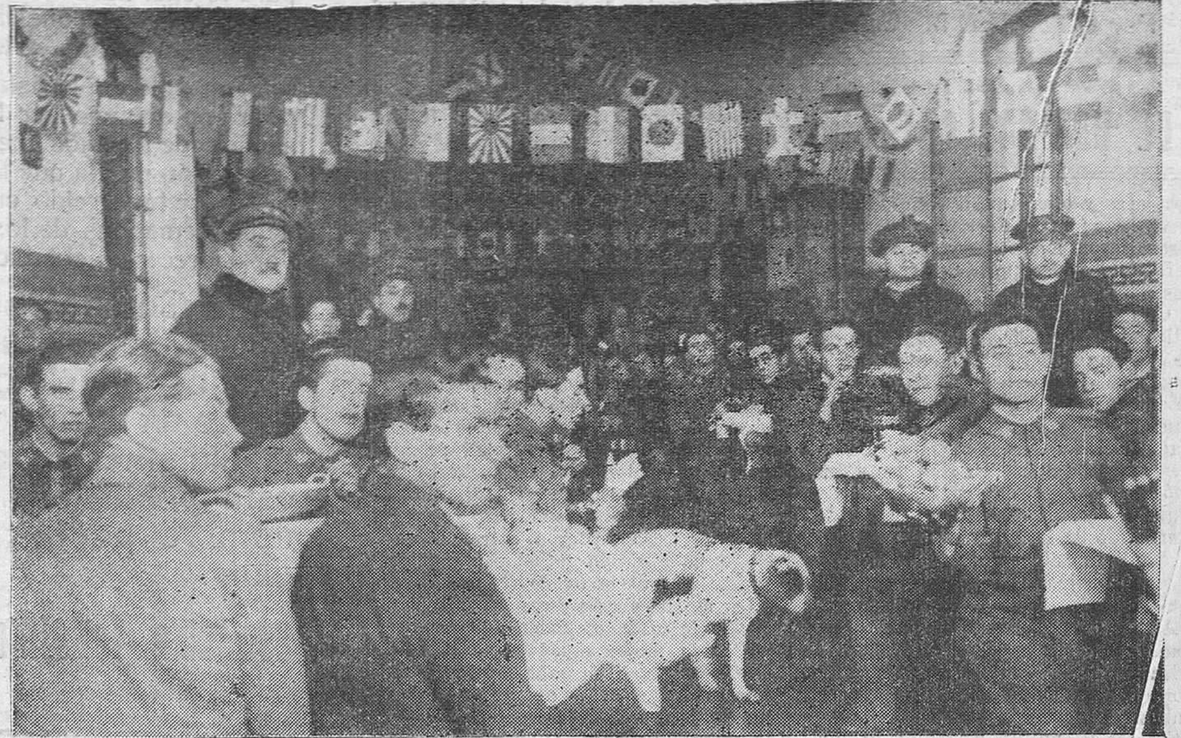
La comida extraordinaria con que fueron obsequiados los soldados y cabos del regimiento Valencia, con motivo de la festividad de la Purísima Concepción, Patrona del Arma de Infantería.