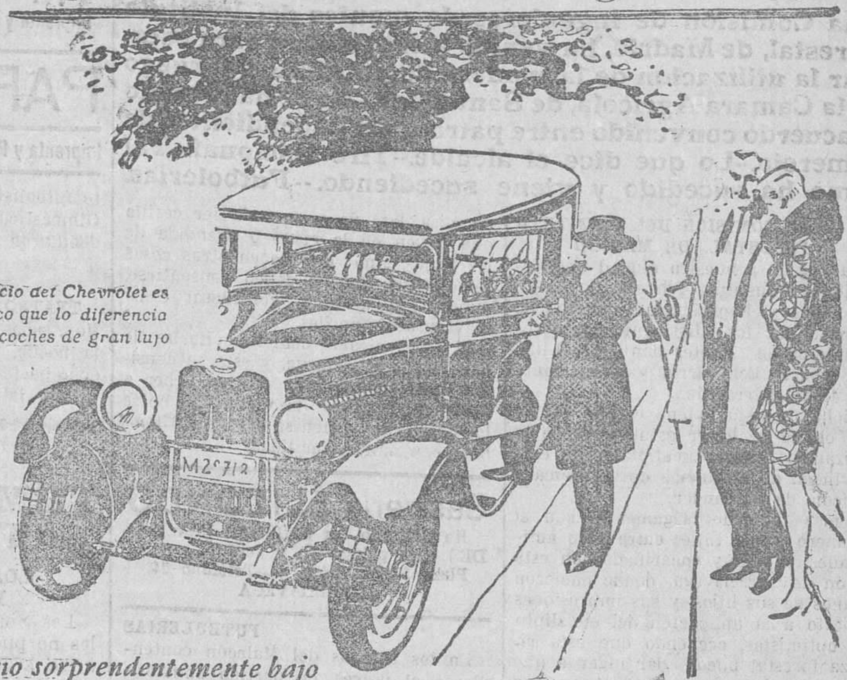
El precio del Chevrolet es lo único que lo diferencia de los coches de gran lujo