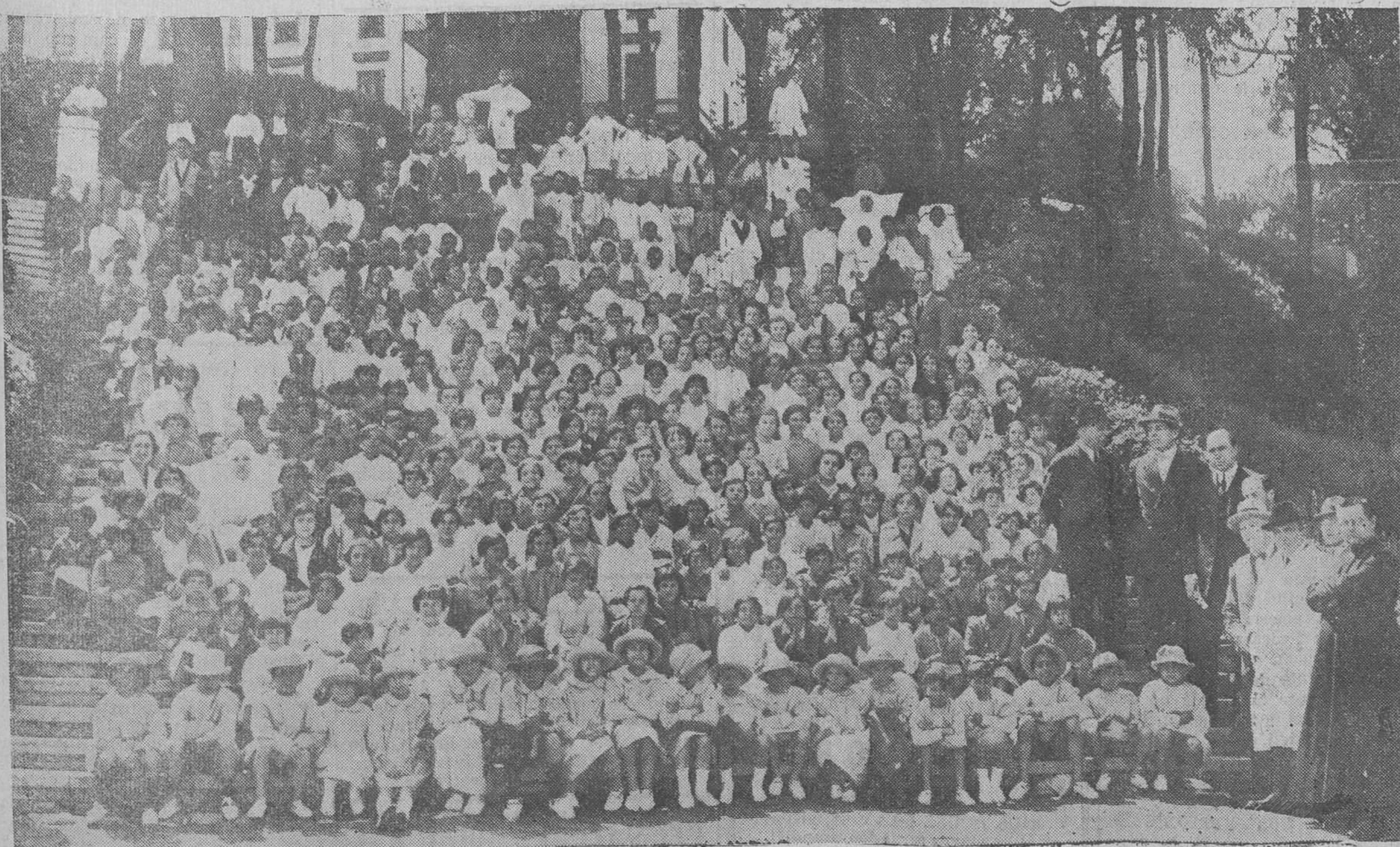
EN EL SANATORIO DE PEDROSA.—GRUPO DE NIÑOS QUE FORMAN LAS COLONIAS QUE ACTUALMENTE SE ENCUENTRAN EN AQUEL ESTABLECIMIENTO.—EN PRIMERA LINEA, LOS DE SANTANDER, QUE AYER COMENZARON SU CURA DE AIRE Y DE SOL.

Lo primero que hemos de hacer es conservar convenientemente estos restos. Luego, salvar los otros, arrancando lentamente las piedras que los tapan. Después excavaremos todo lo necesario en busca de los lugares de la industria lítica, que, poca o mucha, alguna habrá, y con todos estos elementos, debidamente contrastados y com-