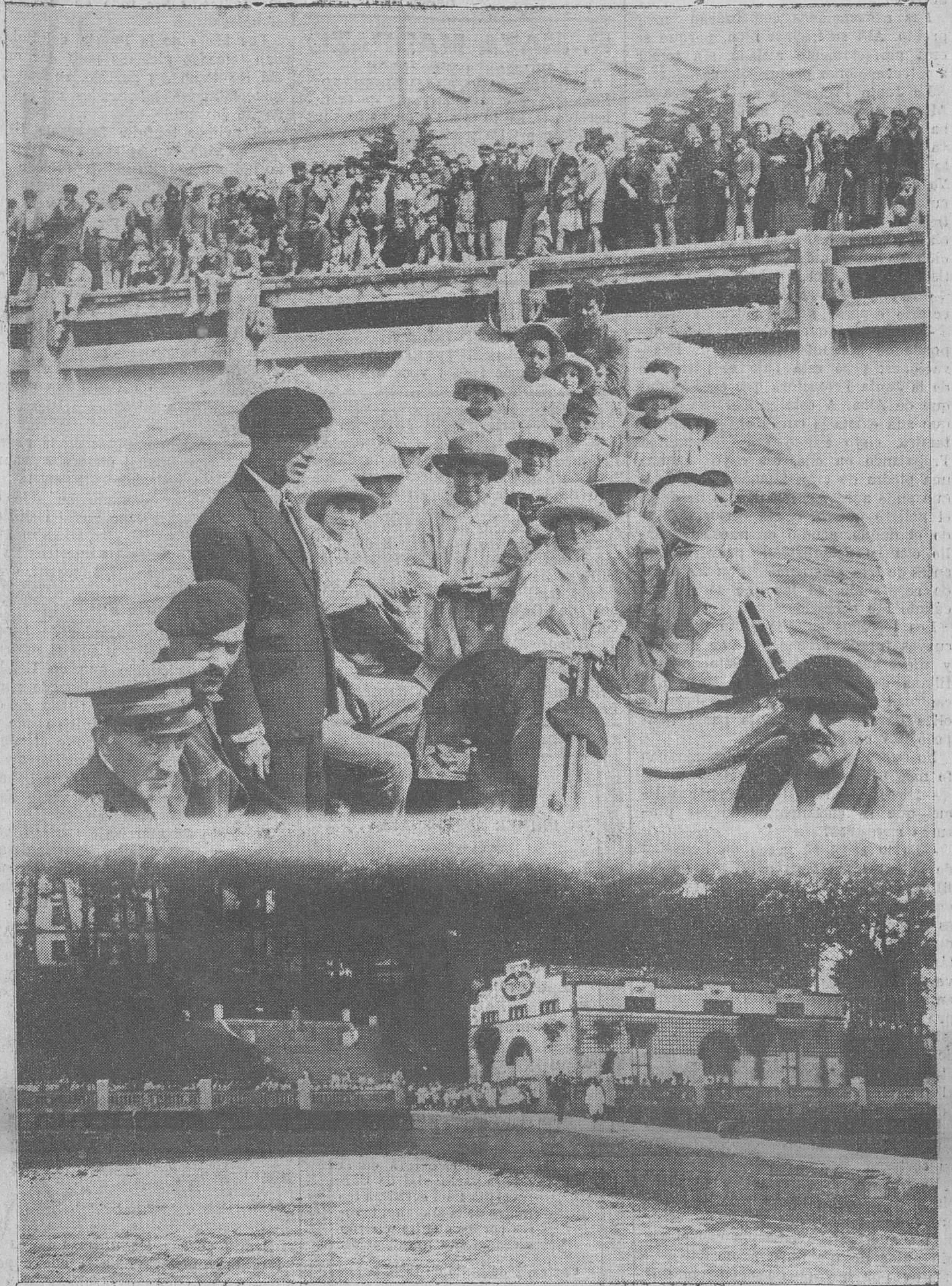
COLONIA INFANTIL SANTANDERINA.—Desde el muelle, las madres y familiares de los niños enviados a Pedrosa por nuestro Ayuntamiento los despiden, y al llegar al Sanatorio son recibidos por los cientos de niños que en aquel incomparable lugar reponen su salud.

Representados por la Casa Monzón ALAMEDA PRIMERA, 20 — TELÉFONO 1176 — SANTANDER.