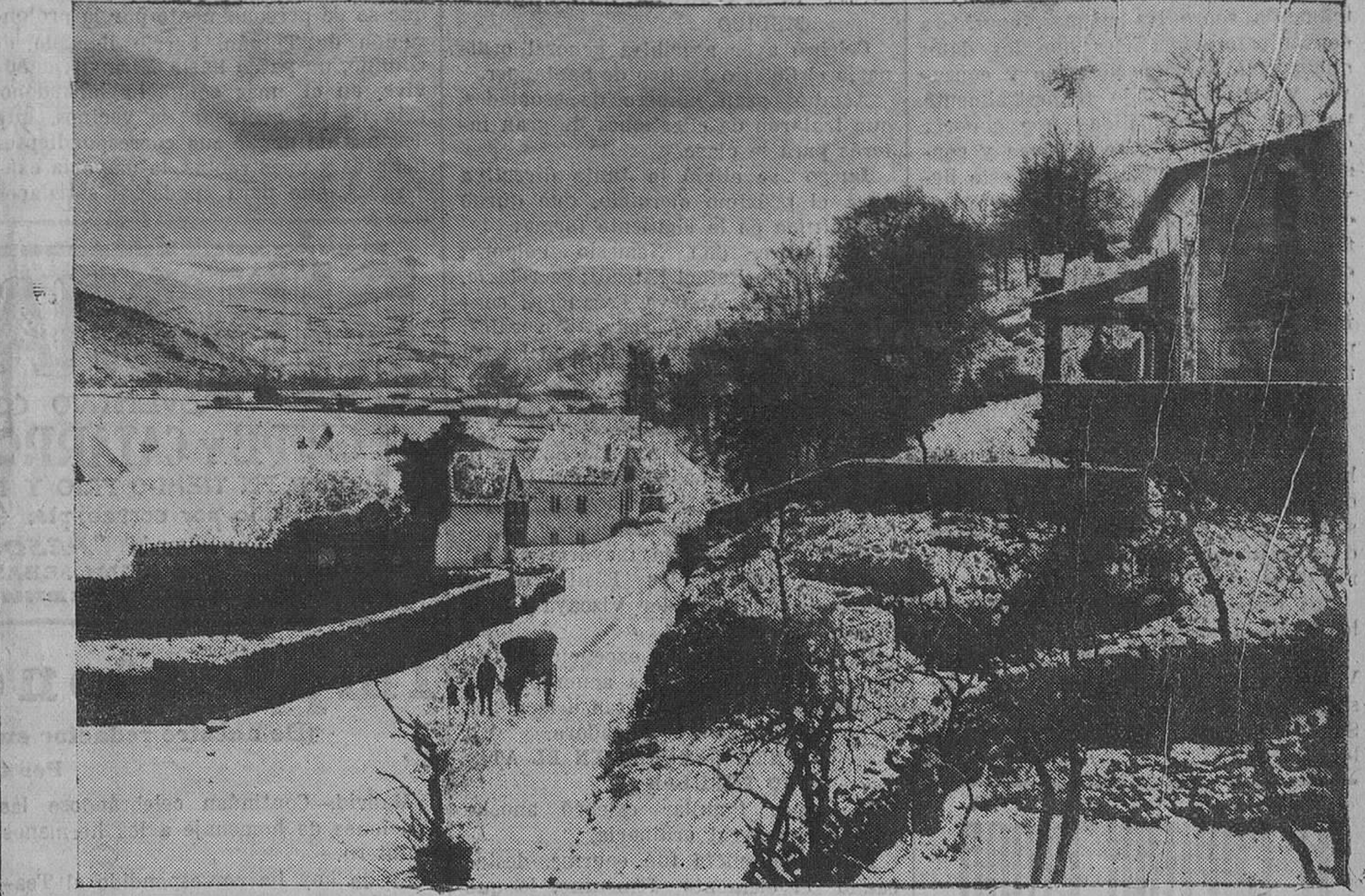
VALLE DE CABUERNIGA.—Aspecto que ofrecen el valle y las montañas bajo la capa de nieve, que ha cubierto estos días la parte alta de la montaña.