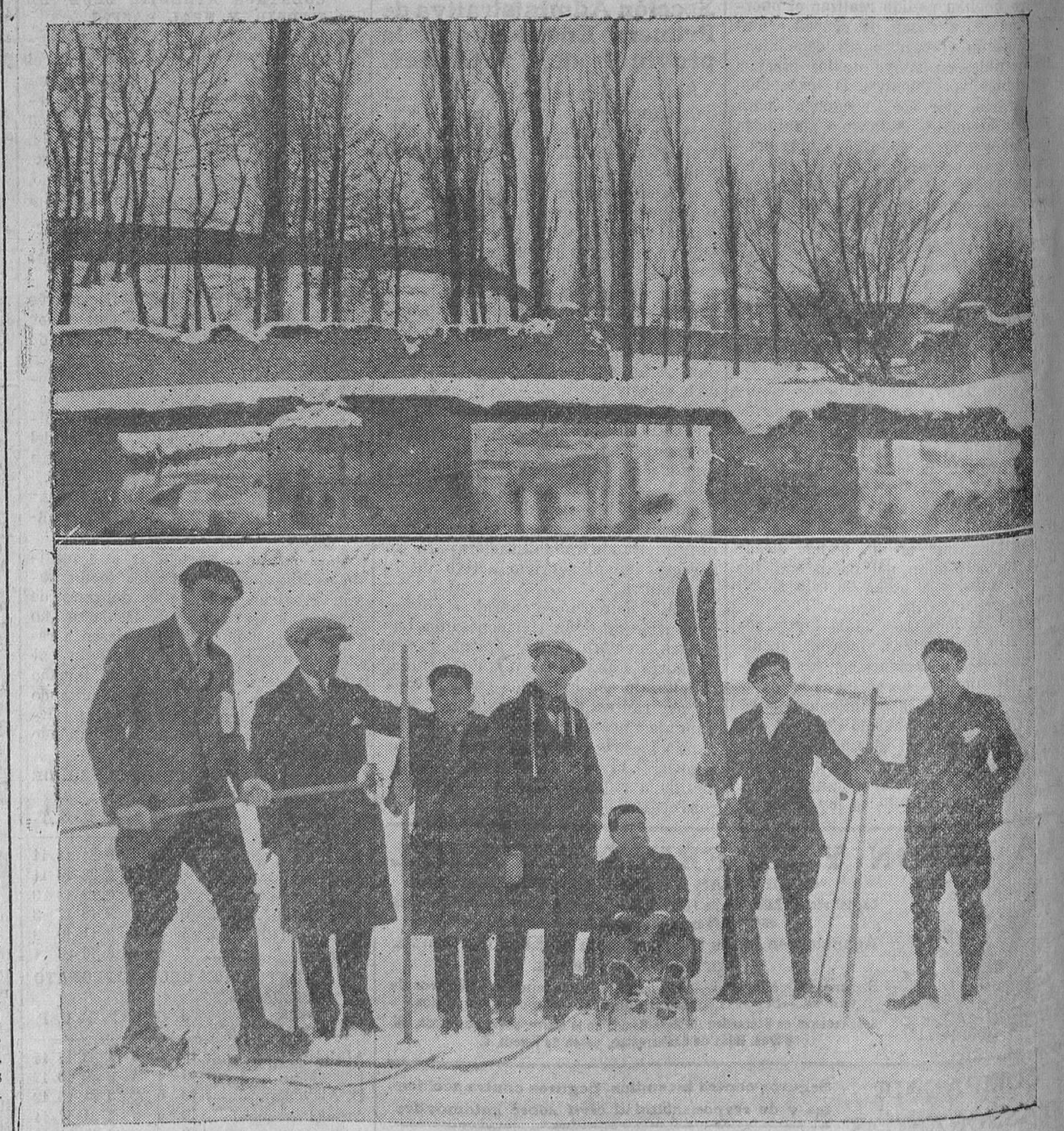
REINOSA. Aspecto de las márgenes del Ebro, con motivo de la reciente nevada, y grupo de alpinistas preparando para hacer una excursión por la nieve.