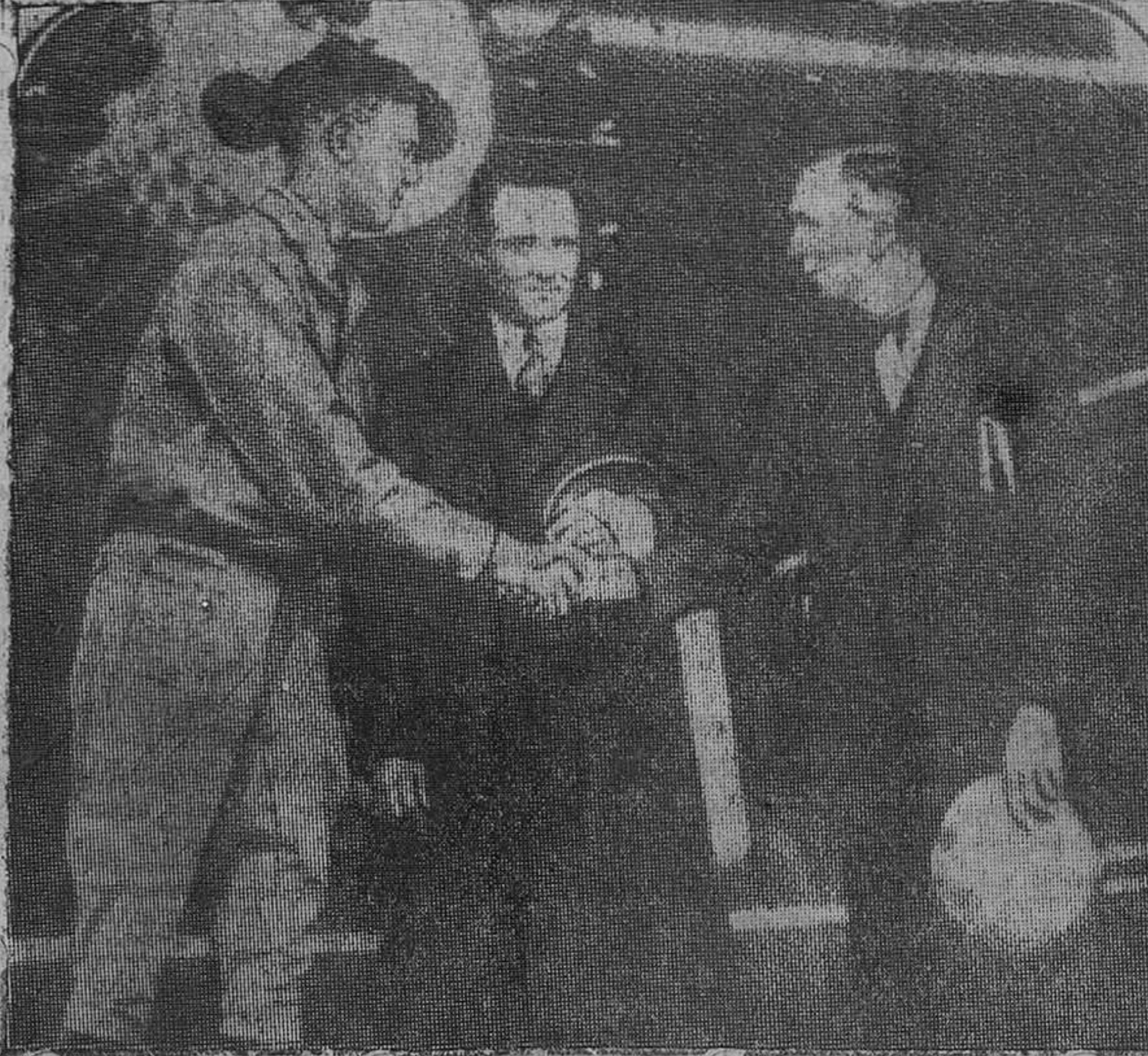
Lindbergh (á la izquierda), hablando, en Nueva York, poco antes de emprender su formidable vuelo á Francia, con Byrd y Chamberlin.

trunción de viviendas podrían ser hechos con garantía de primera hipoteca y con carácter preferente. Será conveniente que la cartera de hipoteca sea pignorable por el Banco de España, por todo su valor, con excepción de timbre y de la póliza y reducción de los honorarios de agentes de Bolsa ó corredores de comercio. Si de la conferencia nacional del Ahorro y la previsión sale la solución del problema de las casas baratas, habrá que volver a esperar que su inmediata construcción sea emprendida activamente en las capitales donde la vivienda económica escasea.