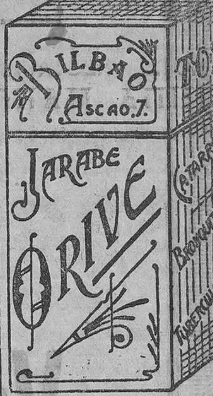
EL MEJOR remedio para EL PEOR catarro. Jarabe Orive. Precio: 425 pesetas.

Para todos vuestros problemas financieros y compromisos, la encontraréis en los PRESTAMOS HIPOTECARIOS.