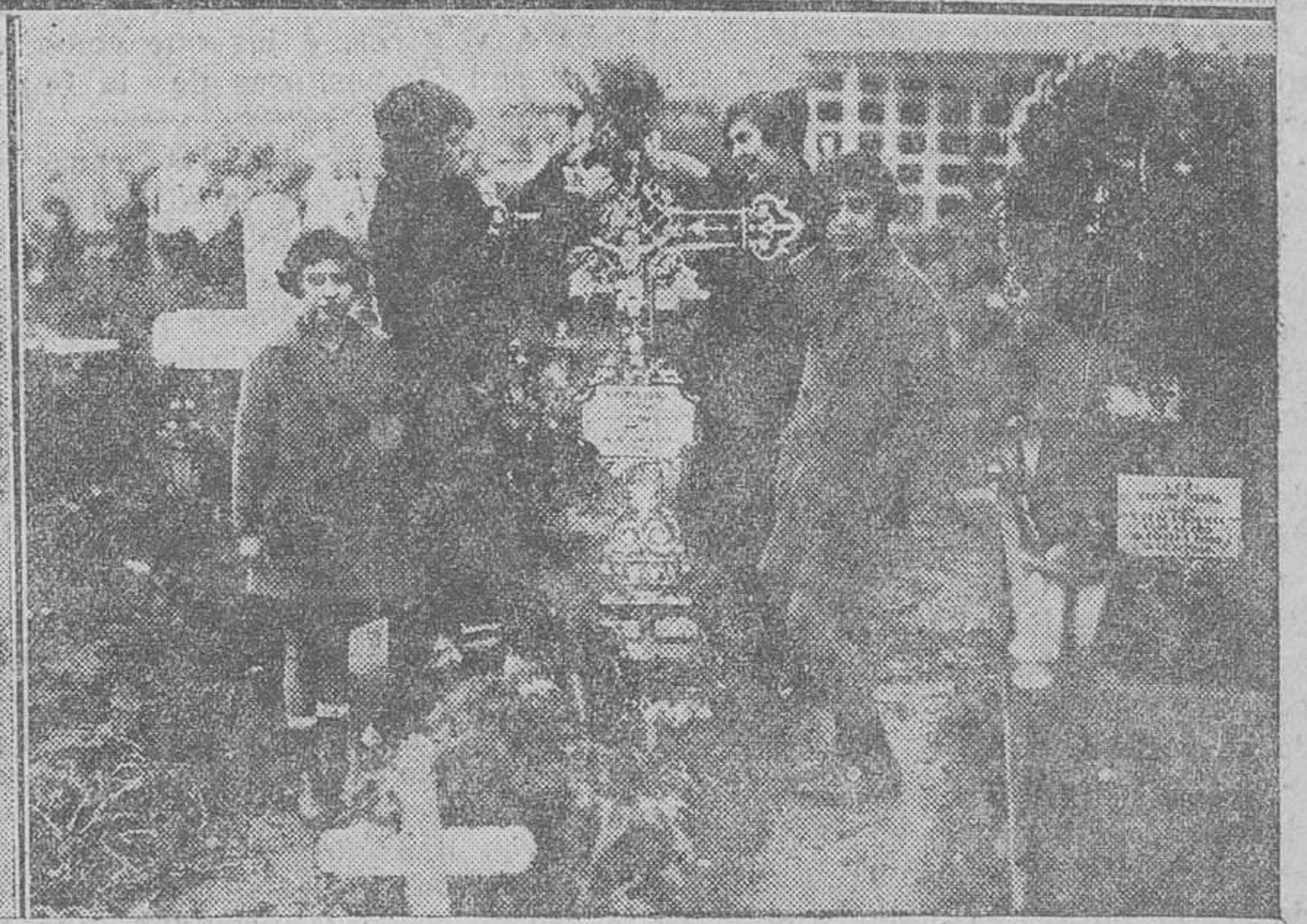
NOTAS GRÁFICAS DE LA VISITA AL CEMENTERIO DE CIRIEGO